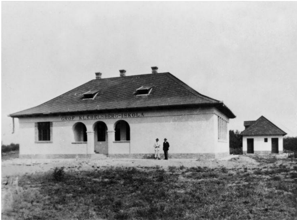
2. ábra – Gróf Klebelsberg-iskola Domaszéken, 1920-as évek végén (Kollega, 1996)

Klebelsberg minisztersége idején kezdődött a sportpályák kiépítése, a margitszigeti Hajós Alfréd Sportuszoda és a Testnevelési Főiskola építése. Megalapította a Magyar Olimpiai Bizottságot és bevezette a kötelező iskolai testnevelést.