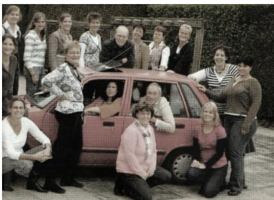
1. ábra A tanári team Voorthuisenben

Hollandia területe 41 526 km 2 , lakossága 16 500 000 fő, népsűrűsége 397 fő/km 2 , és 12 tartományra tagolódik. Államformája 1815-ben lett alkotmányos monarchia, és 1848 óta parlamentáris demokrácia. A holland parlament tekintélyes befolyással rendelkező része, az Alsóház (Tweede Kamer), amelynek 150 tagját négyévente választják meg.