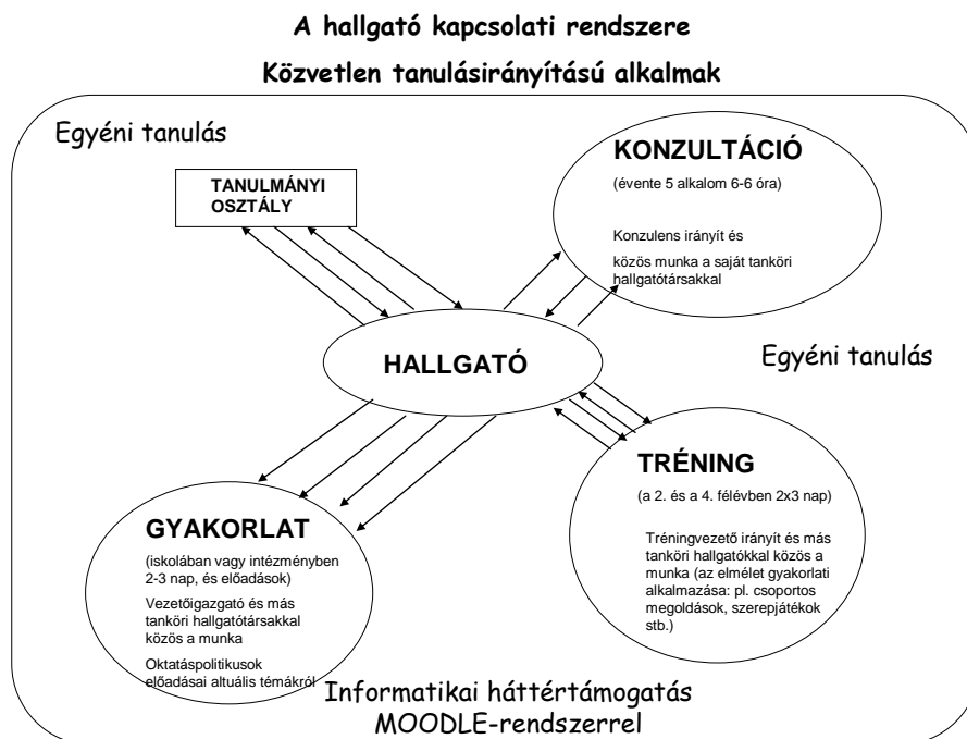
5. ábra A távhallgatók kapcsolati rendszere a BME-n

A hallgató-oktató kapcsolati rendszerét a következő ábra szemlélteti: