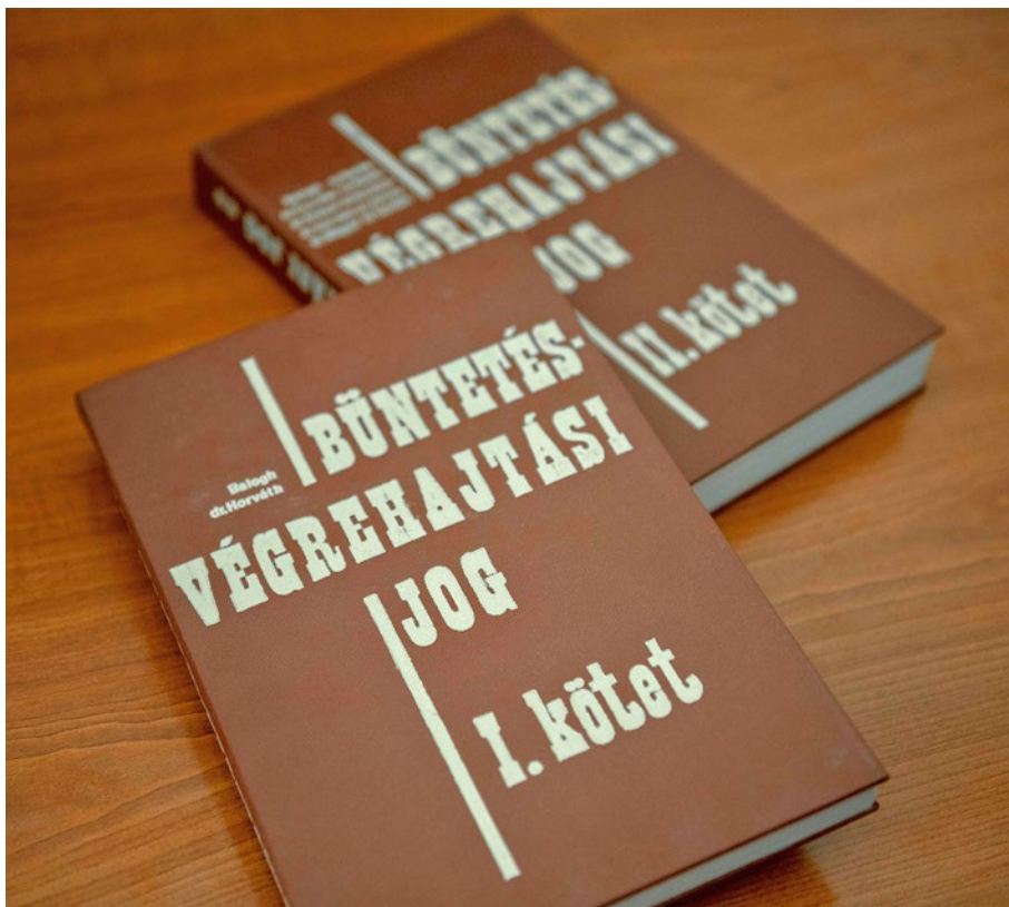
2. kép: A „Büntetés-végrehajtási jog” című tankönyv I. és II. kötete

tartalmazó szintézise (Büntetés-végrehajtási jog I-II. BM. Kiadó, Budapest, 1983. Szerk.: Horváth Tibor). A tankönyv – azon kívül, hogy jelentős segítséget nyújtott a börtönügy személyi állományának képzésében, a büntető igazságszolgáltatásban dolgozók tájékoztatásában – hozzájárult a büntetés-végrehajtási jog jogági elismeréséhez és a büntetés-végrehajtási tudomány jogtudományi jellegű műveléséhez.