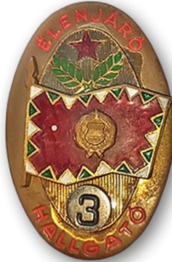
1. kép: Háromszoros élenjáró hallgatói jelvény a 80-as években, melynek megszerzéséhez meghatározott tanulmányi átlagra, valamint kifogástalan fizikai felkészültségre volt szükség 1

A képzési rendszerben mintegy 1 130 órában szerepeltek még az olyan foglalkozások, mint a szakmai gyakorlat, a testnevelés, az idegen nyelvi képzés, a gépjárművezetői jogosítvány megszerzése, illetve a katonai-karhatalmi felkészítésre fordítandó óraszám. A 80-as évek végéig ebben a rendszerben lényeges változás nem történt.