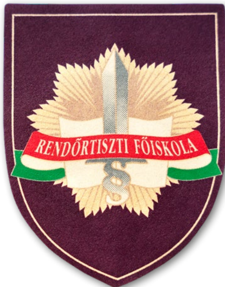
5. kép: A Rendőrtiszti Főiskola karjelvénye, mely 1995-ben lett rendszeresítve

Az átképzés időtartama a 90-es évektől – az ismeretanyag bővülése és a követelmények emelése miatt – 120 órára növekedett. Tanszékünk így évente átlagosan 100 fő tiszti, illetve tiszti beosztású polgári alkalmazotti fluktuáció utánpótlását készítette fel a szolgálatba, illetve munkába lépésükhöz szükséges legfontosabb szakmai ismeretekre. Így a 90-es években a tiszti utánpótlás egyharmadát belső (saját képzési rendszerben), kétharmadát külső forrásból pótolta a testület.