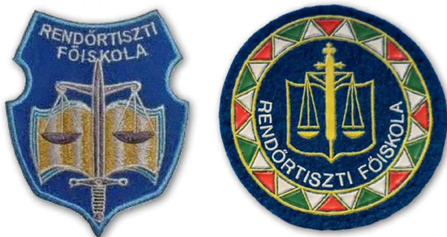
6-7. kép: A 2000-es évek karjelvényei

megteremteni. Ennek az időszaknak a legjellemzőbb elmozdulása a pedagógia és a pszichológia térnyerése. Véleményünk szerint az elmúlt közel húsz év alatt sikerült a biztonság és a jog mellé – tehát nem mögé, de nem is elé – a pedagógiai látásmód általános érvényű elfogadását és alkalmazását megteremteni. Arra törekszünk, hogy a hallgatóknak ne csupán elkülönült tantárgyakat közvetítsünk, hanem egy emberközpontú és átfogó megközelítést kínáljunk fel.