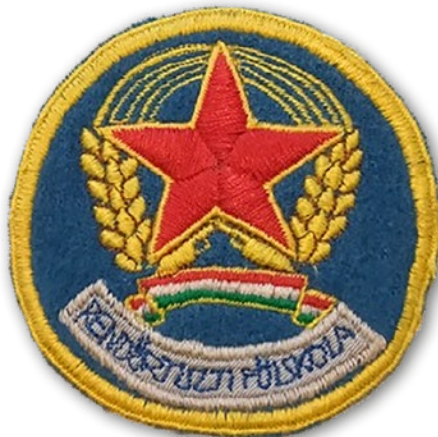
4. kép: A Rendőrtiszti Főiskola karjelvénye, mely 1987-ben lett rendszeresítve

1987-ben, a tisztképzés megindulásának tizenötödik – az első kibocsátás tizedik – évfordulóján tekintettük át először átfogóan az addig végzett munka eredményét.