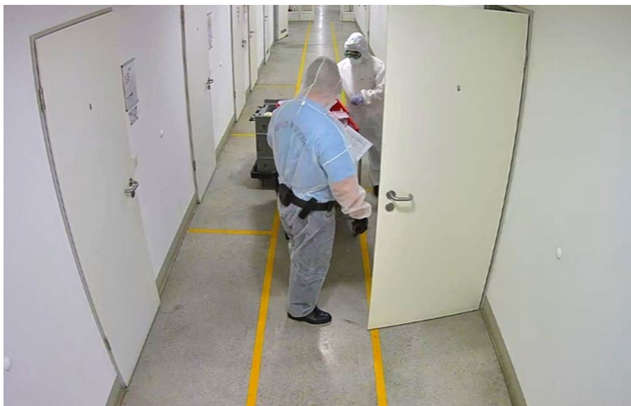
3. ábra: Védőfelszerelésben történő szolgálatellátás

gyanúja, vagy igazolt megállapítása esetén, az ellenszegülő fogvatartottakkal szembeni hatékony és gyors intézkedések megtétele, továbbá a fertőzés lokalizálása, illetve terjedésének megelőzése érdekében a szolgálati feladatok közvetlen irányításával és végrehajtásával megbízott személyek részére iránymutatással szolgáljon.