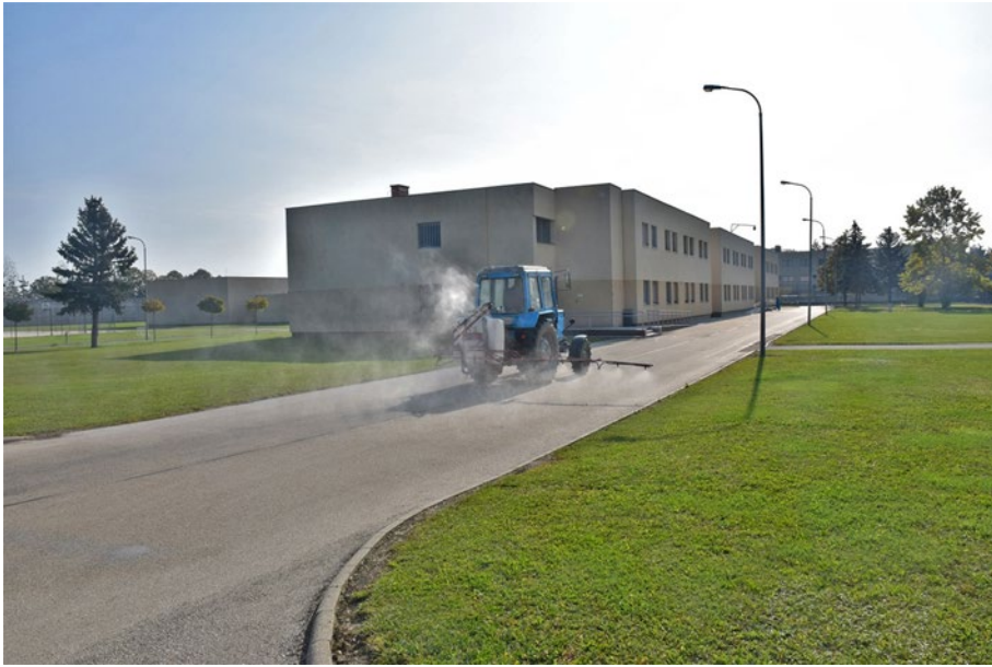
1. ábra: Kültéri közlekedési útvonal fertőtlenítése

Amikor területek védelméről esik szó, meg kell említeni a személy- és teherszállító gépjárműveket is. A bv. intézet által használt gépjárművek vonatkozásában napi szintű, valamint használatot követő fertőtlenítés került végrehajtásra.