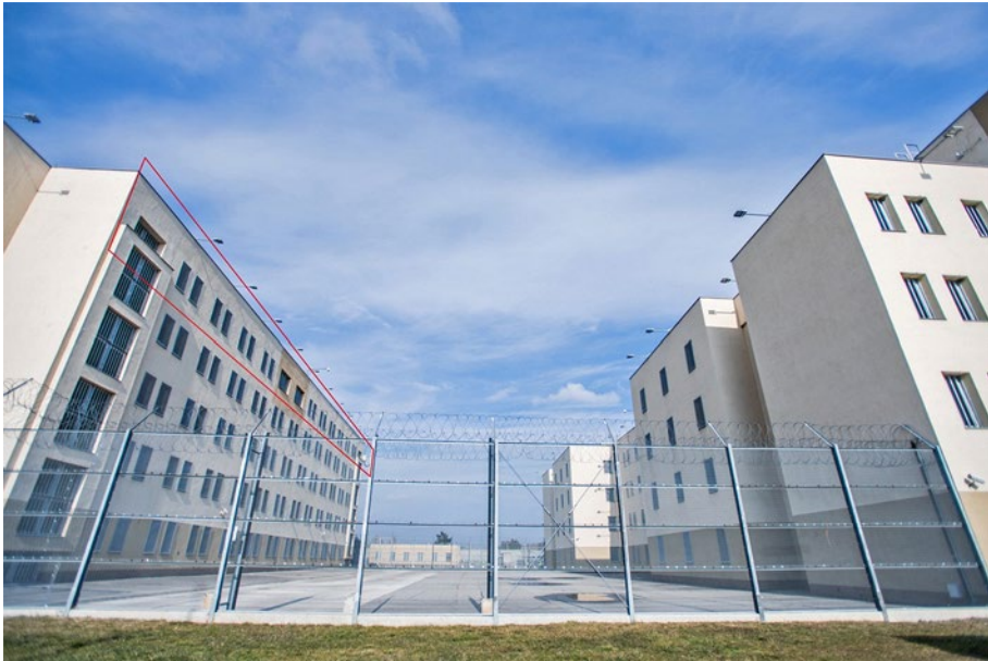
2. ábra: Krónikus betegek elhelyezésére szolgáló körletrészt

Az egyes fogvatartotti közösségeket – mint az azonos zárkában elhelyezetteket, vagy egy munkahelyen foglalkoztatottakat – érintően felmerülő fertőzészgyanú esetén, a közösséghez tartozó fogvatartottak zárkáinak zárva tartása, valamint az érintettek mozgásának, mozgatásának szigorú kontrollja is hatékony eszköznek bizonyult a védekezés során.