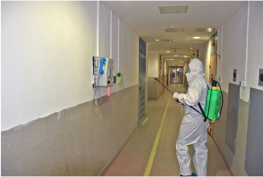
3. ábra: Felületek és eszközök fertőtlenítése a belső térben

vesszük, hogy a fertőzésben érintett fogvatartottak több mint 30%-a a befogadási eljárás keretein belül került kiszűrésre, vagyis a fertőzéssel nem a szabadságvesztésének időszakában, hanem még civil körülmények között került kapcsolatba, akkor még inkább felértékelődni látszik a bevezetett intézkedések hatékonysága.