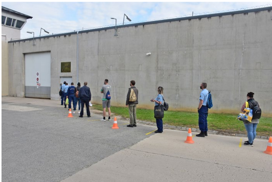
4. ábra: A személyi állomány beléptetése egyéni védőeszközök használatával és védőtávolság megtartásával

hozzájárult a működési stabilitás megőrzéséhez. Itt kell megjegyezni, hogy a védekezés időszaka alatt egyetlen alkalommal sem volt tapasztalható visszaélés az egyéni munkarendekkel kapcsolatban.