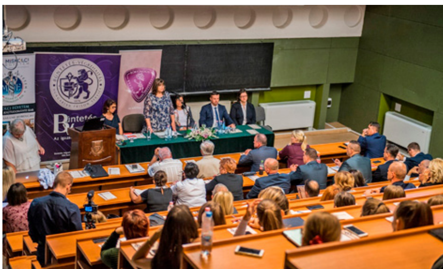
7. fotó: Miskolci Egyetem, Állam- és Jogtudományi Kar