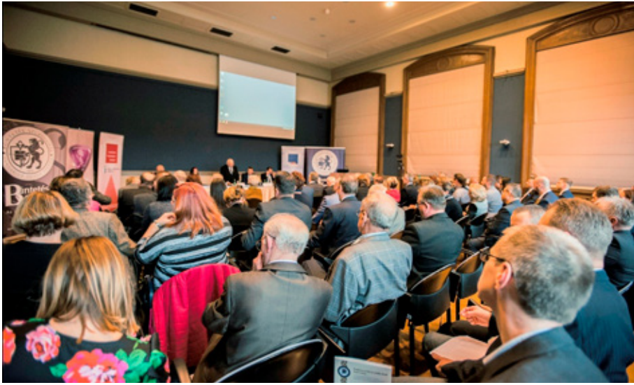
8. fotó: Magyar Tudományos Akadémia

lehetséges reakciókba a fiatalok jogsértő magatartásai kapcsán, a Fiatalok Bűntetés-végrehajtási Intézete reintegrációs törekvéseibe, a fiatalok szabadságvesztés-bűntetésének végrehajtásába, a reintegráció fogalmába Magyarországon és Európa egyes országaiban, a Bűntetés-végrehajtási Szervezet gazdasági társaságainál történő munkáltatásba, valamint a foglalkoztatás és (szakma)képzés jelentőségébe a bv. reintegrációs tevékenysége kapcsán.