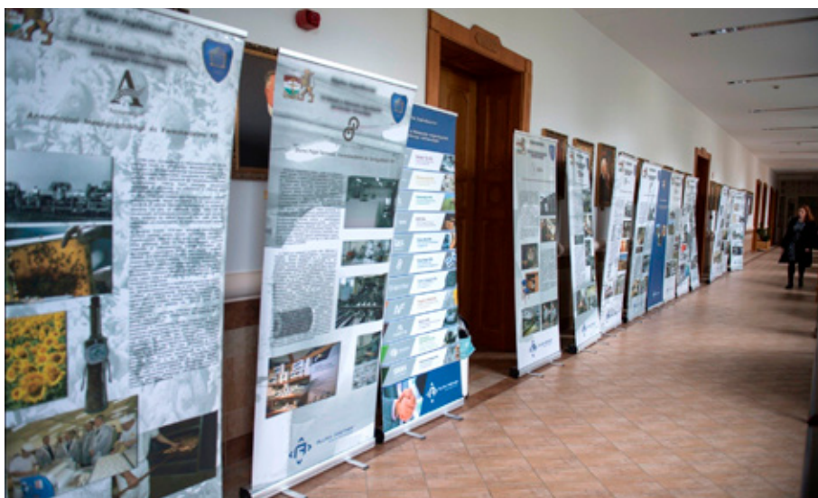
6. fotó: Pécsi Tudományegyetem, Állam- és Jogtudományi Kar