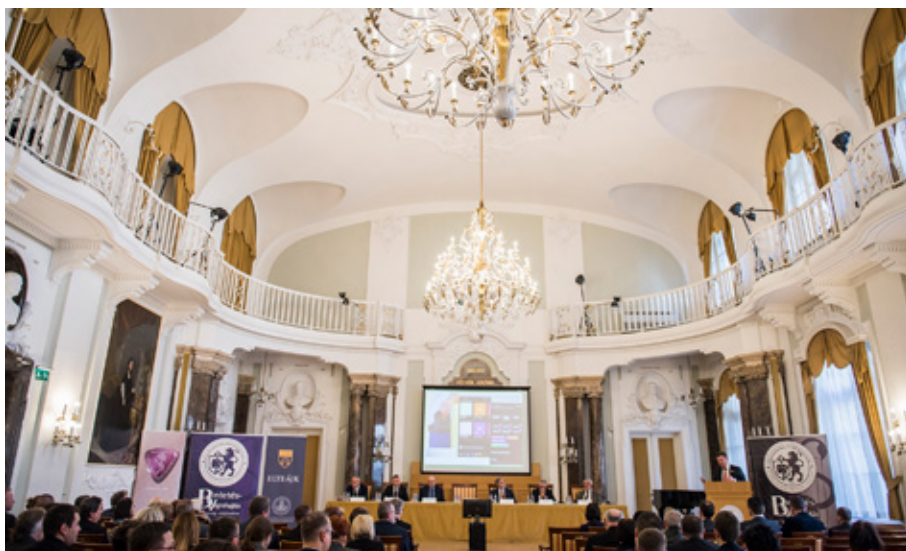
3. fotó: Eötvös Loránd Tudományegyetem, Állam- és Jogtudományi Kar