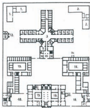
Szegedi Fegyház és Börtön

Tervei – a helyi adottságokat figyelembe véve – tartalmazták a kor technikai újdonságait: a központi fűtést, a villanyvilágítást, a felvonókészüléket. Törekedett arra, hogy az elkészült épületek szakmai szempontból minden igényt kielégítsenek, emellett impozánsan illeszkedjenek az adott városképhez.