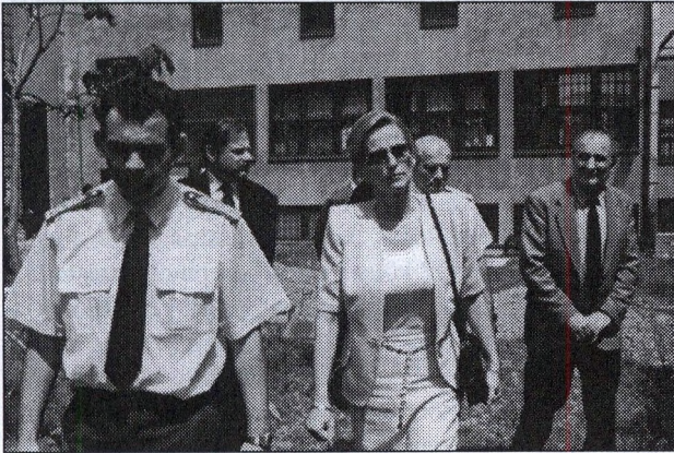
A leendő emlékparkban

– Folyamatosan bemutatja a tervezés és a kivitelezés dokumentumait a BvOP-nak, hogy az üzemeltetési és a biztonsági szempontok érvényesíthetők legyenek.