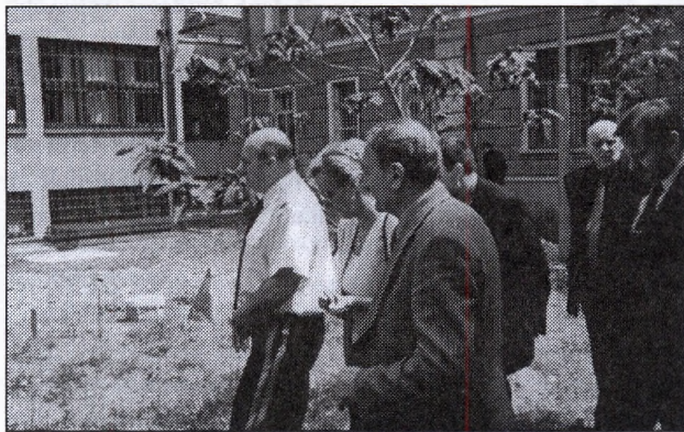
Területbejáráson a miniszter, a POFOSZ elnöke és az országos parancsnok

– A BvOP a létesítéssel szorosan összefüggő költségek, a költségvetést terhelő összegének meghatározására felmérést készít.