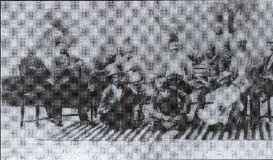
A kép 1892-ben készülhetett, mivel dr. Szabó Lajos 2 éves ítélettel az 1890. augusztus 4-i névsorban szerepel, de a fák már lombosak...

ma is álló épületébe, ahová három hónapja költözött Vácról az államfogház. Hivatásának megfelelően a vérbeli újságíró Gárdonyi Géza azonnal megkezdi lapja, a Szegedi Napló tudósítását az államfogházból. A cikksorozat címe találó: Az állami emberszélidítőben , az alcíme pedig Egy államfogoly naplójából .