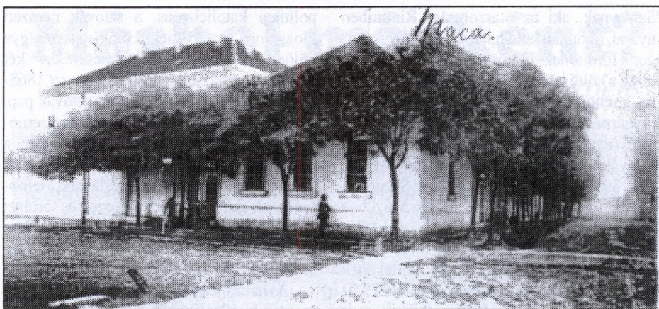
Az államfogház épülete. A képen fordítva van a negatív. A fákról ítélve a századfordulón készült a képeslap

losan is lehetett ebédet hozatni a fogvatartottaknak. A rendszeres kártyázáshoz és esti nótázáshoz is mindig került hangulatkeltő nedű. Octavian Goga , Petőfi román fordítója, Ady Endre barátja szintén járt a szegedi államfogházban. Ady Endre levélben köszöntötte szegedi fogsága alatt a költőt, műfordítót, a román nemzeti mozgalom vezetőjét, aki ekkor már Petőfi avatott román fordítója. Octavian Goga sajtóvétségért kapott büntetését töltötte Szegeden 1912-ben.