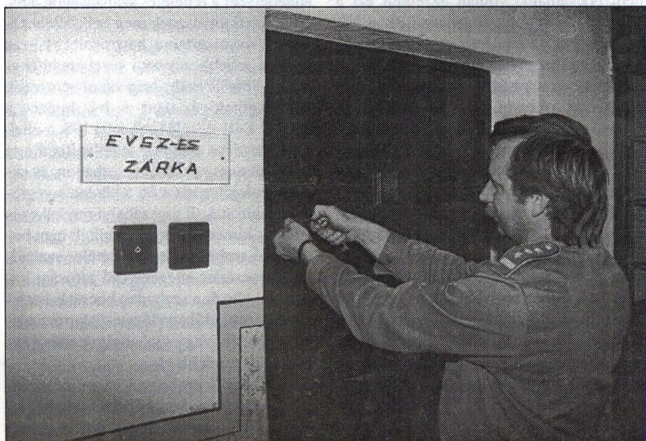
Az összes körülmény gondos mérlegelése alapján lehet dönteni

alkalmazási nehézség merülhet fel a végrehajtás egyéb területein is. Az enyhébb végrehajtási szabályok (evsz.) alkalmazásával összefüggésben ilyenek például két irányban is keletkezhetnek. Előfordulhat, hogy az elítélt fogház- vagy börtönfokozatban tölti a büntetését, amelyben a bíróság engedélyezte a végrehajtási szabályok enyhítését, ezt követően azonban olyan újabb szabadságvesztés-büntetés végrehajtására érkezik értesítés, amit nem lehet összbüntetésbe foglalni. Ilyen eset a korábbiakban is előfordult, ezért mondta ki a Bv. szabályzat 169. §-a (1) bekezdésének c) pontja, hogy a parancsnok az enyhébb végrehajtási szabályok alkalmazását felfüggesztheti, ha az elítélttel szemben újabb szabadságvesztés végrehajtására érkezik értesítés, ilyen esetben a megszüntetés iránt haladéktalanul előterjesztést tesz a bv. bírónak. Figyelemmel azonban