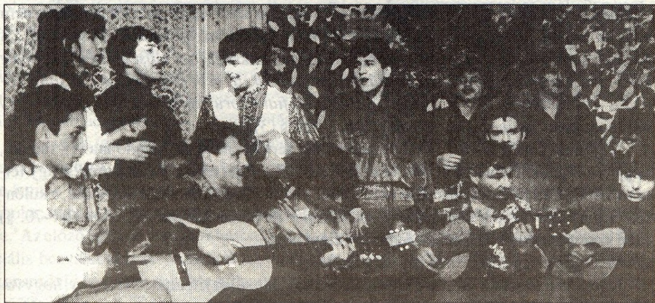
Fiatalkorúaknál természetes a nevelés gondolata