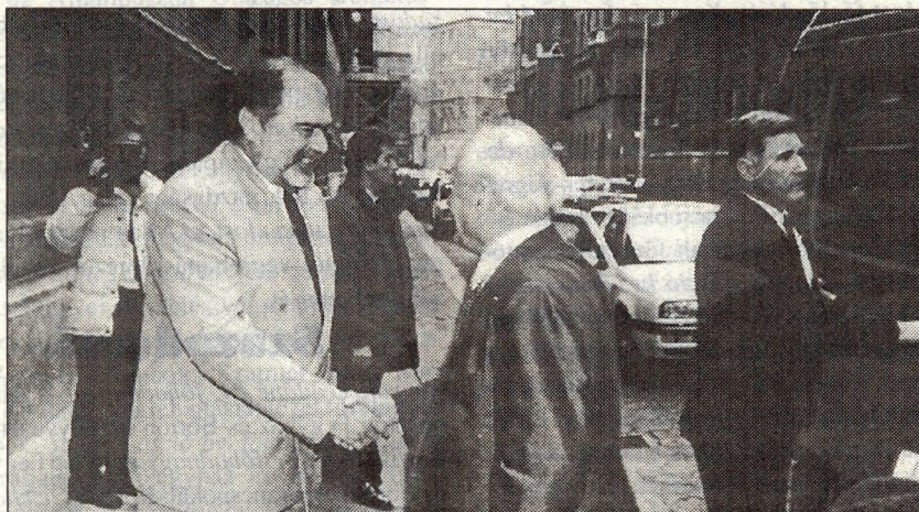
Göncz Árpád köztársasági elnök az elmúlt évben a Fővárosi Büntetés-végrehajtási Intézet Nagy Ignác utcai objektumában ismerkedett a fiatalkorú előzetesek elhelyezési körülményeivel