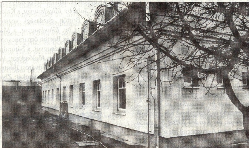
Az egykori szovjet katonai laktanya átalakítását követően, január 24-én, megtörtént a kecskeméti új börtön műszaki átadása