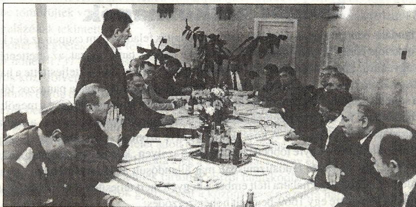
Február 8-án dr. Kovács Pál népjóléti miniszter Pálhalmán találkozott a büntetés-végrehajtás és a többi fegyveres testület és rendészeti szerv egészségügyi szolgálatának vezetőivel. Kölsönösen tájékoztatták egymást a magyar egészségügy megújulásának tennivalóiról.