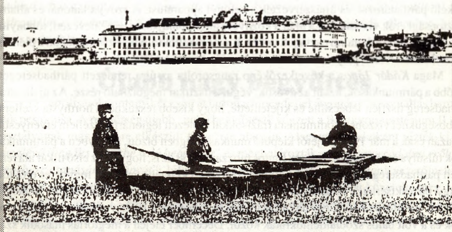
A váci fegyintézet rajza