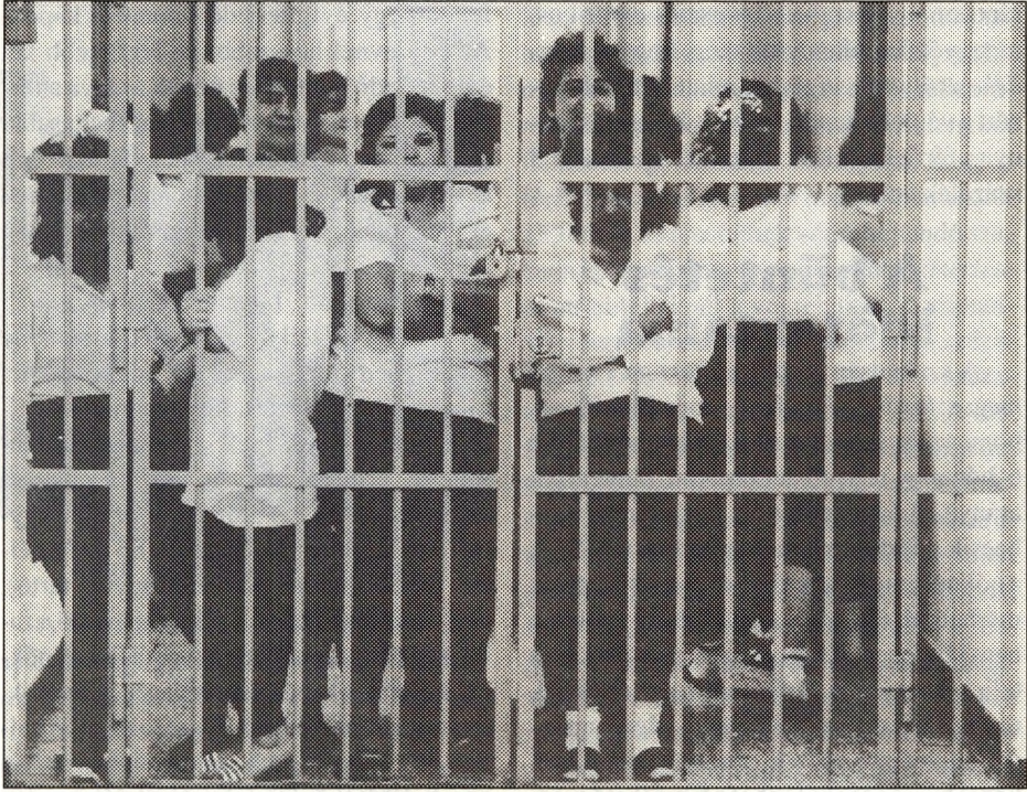
A elítélt nők 10,9 százalékát ítélték fegyházbüntetésre

A büntetés-végrehajtási fokozat szerinti megoszlás is különbözik a férfiaknál és a nőknél, bár az eltérés az arányokat illetően nem számottevő. A végrehajtandó szabadságvesztésre ítélt férfiak 10,3 százalékát, a nők 10,9 százalékát ítélték fegyházbüntetésre, a börtönbüntetésre ítélték aránya a férfiaknál 83,8 százalék, a nőknél 79,8 százalék volt, a fogházbüntetésre ítélték aránya 5,9 százalék, illetőleg 9,3 százalék. A fegyházbüntetések magas aránya a nőknél a legsúlyosabb élet elleni bűncselekményekkel magyarázható.