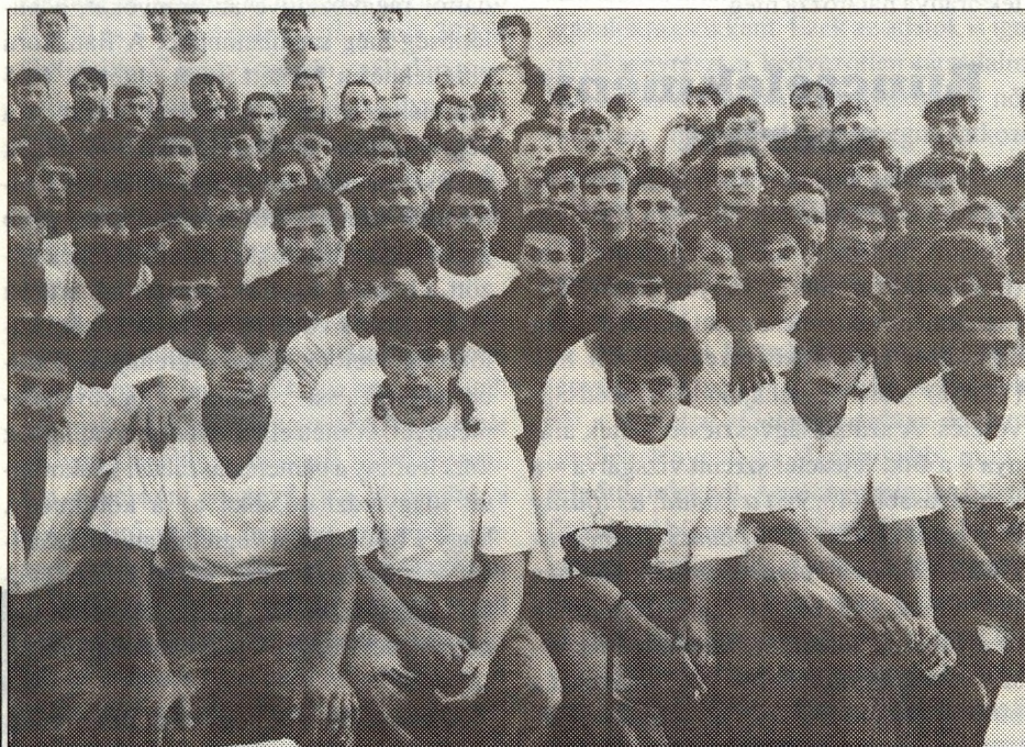
Gyakori a vagyon elleni bűncselekmény