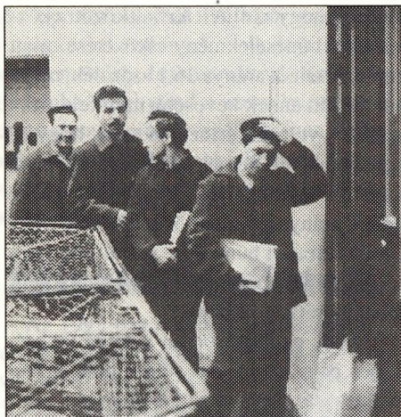
Nagy a különbség a vétség és büntett miatt bekerülők arányában

A végrehajtandó szabadságvesztés arányában megfigyelhető számottevő különbség némiképp csökken, ha azt a közlekedési bűncselekmények elkövetése miatt elítéltek nélkül számítjuk. Ebben az esetben ugyanis a végrehajtandó szabadságvesztésre ítélt aránya a férfiaknál 23,7 százalék, a nőknél 11,0 százalék lesz.