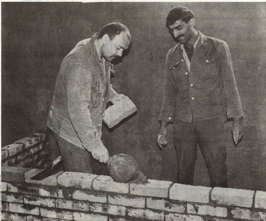
Üzleti alapon nem megy...

Az 1990–1992-es évek (amikor a büntetés-végrehajtási vállalatok gazdasági-pénzügyi helyzete erőteljesen romlott és öt vállalat csődöt jelentett) bebizonyították, hogy az elítéltek munkáltatása Magyarországon sem szervezhető meg kizárólagos üzleti alapon. Az elítélt-foglalkoztatás sajátosságai mellett súlyosan érinti a vállalati eredményességet, hogy a munkavégzés minden mozzanatában érvényesülnie kell a speciális büntetés-végrehajtási követelményeknek és szempontoknak. Az elítéltek szállítása, őrzése, betanítása, a biztonsági