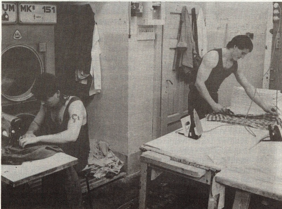
A gazdálkodó szervezet nonprofit jellegű lesz

Jelenlegi elképzelésünk szerint a vállalatok átalakítását egyszemélyes korlátolt felelősségű társasággá (a továbbiakban: Kft.) kell megkezdni, így minden tulajdonjogot megtestesítő üzletrész az igazságügy-minisztert illetné meg. Ez a gazdasági társaság tovább alakítható a jogszabályok ha-