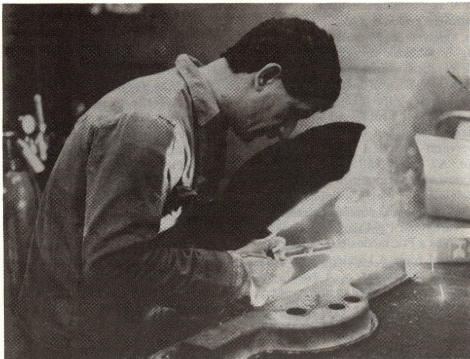
Az átalakítás szerteágazó, aprólékos feladat

tálya lépése után — amennyiben az azokban foglalt feltételek kedvezőbbek — közalapítványi illetve az ahhoz kapcsolatosan működő közhasznú társasági formába. A kapcsolódást alapvetően az igazságügy-miniszter személye határozza meg, aki részt vesz a közalapítvány kuratóriumában és egyben a kft.-k tulajdonosa is.