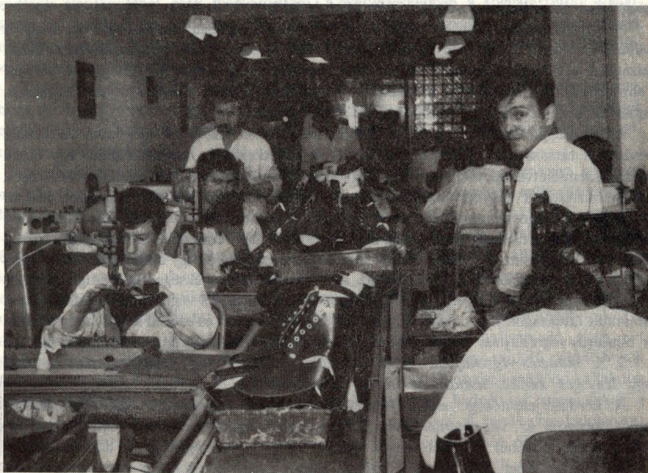
Az átalakulás elkerülhetetlen

1. Az előző fejezetben megfogalmazott szervezési elvek alapján minden további lépést megelőzően azt kell megvizsgálni és mélyreható elemzésekkel megalapozni, hogy a jelenlegi büntetés-végrehajtási vállalatok közül melyeknél elkerülhetetlen a költségvetési üzemmé való átszervezés. Ennek részletes ismertetésére nem térek ki, mert a pályázati felhívás sem ilyen irányultságú.