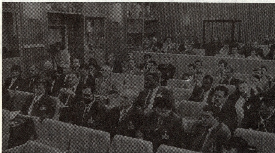
Magyarországon e témakörben ilyen széles körű tanácskozásra még nem volt példa