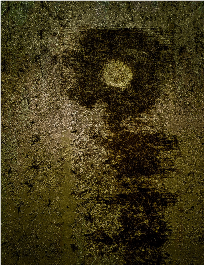
Molnár István Tényleg —Ringvägen 16

Tomrummet i mitt huvud syns tack och lov inte ens på röntgenbilder. Endast på grottmålningar.