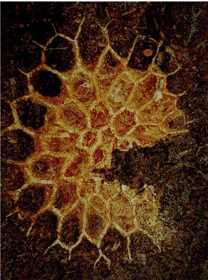
Molnár István Multiplex — Kocksgatan 22

A fejmben lévő üresség szerencsére még a röntgenképeken sem látszik. Kizárólag a barlangrajzokon.