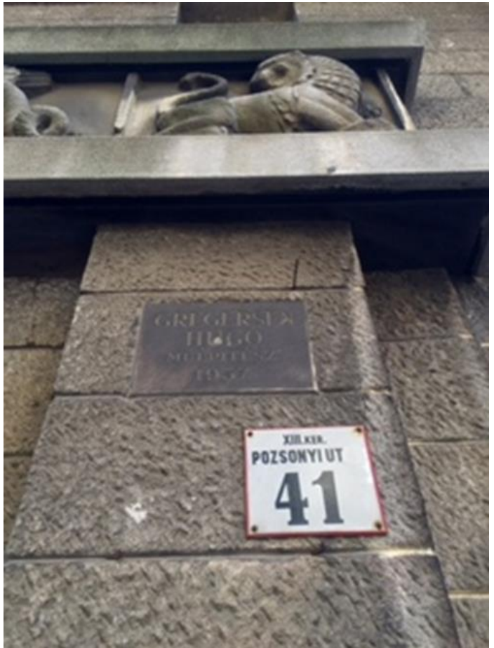
Pozsonyi út 41. (Herzen utca 8)