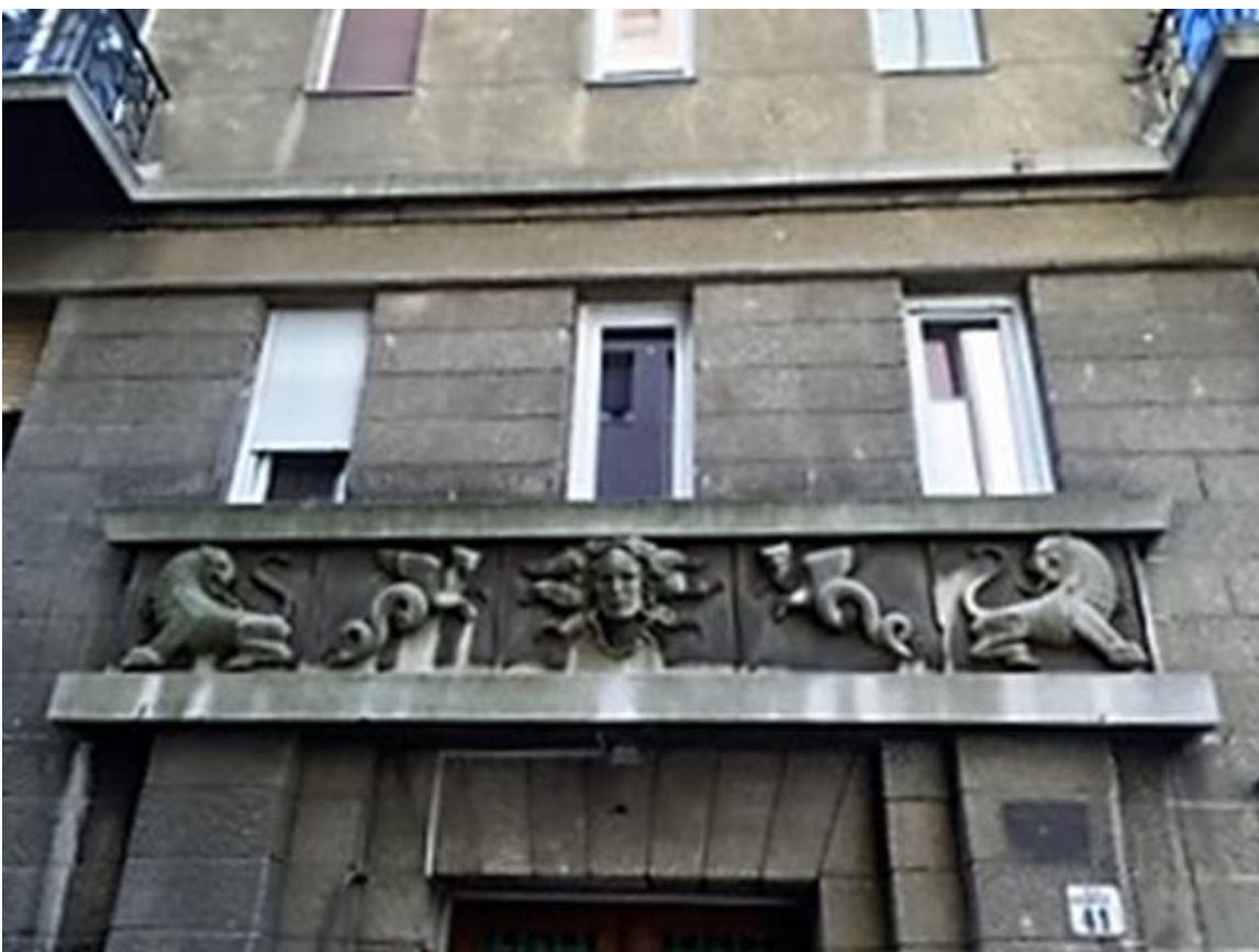
Pozsonyi út 41 (Herzen utca 8)