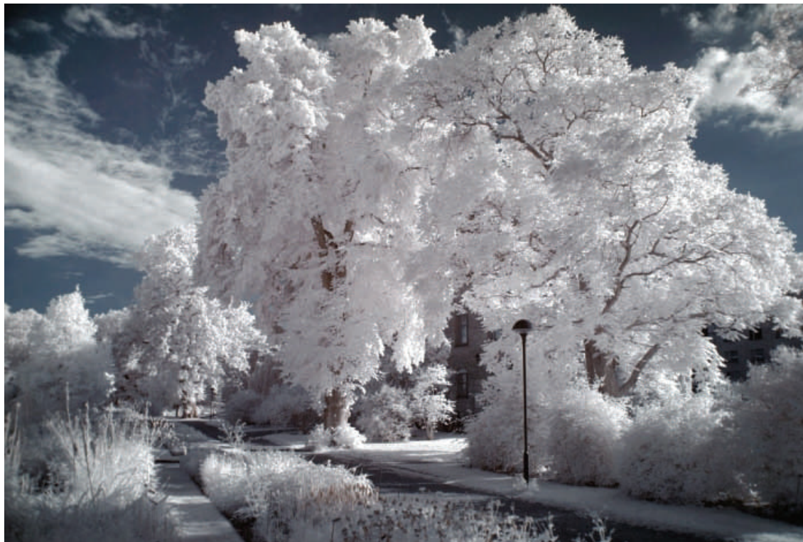
Székely János: Svédországi "tél" - fotó