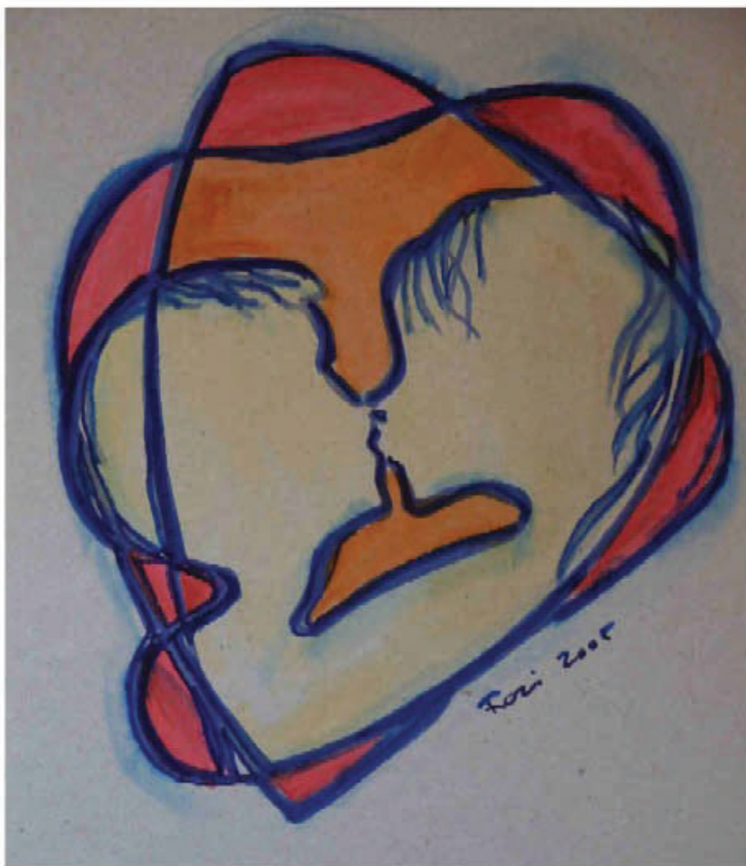
Gyarmati Rozália: Pusz , 2005