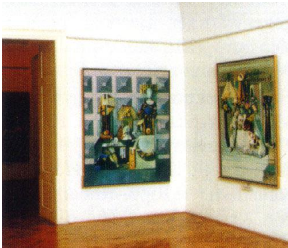
Nemes Endre alkotásai a pécsi múzeumban