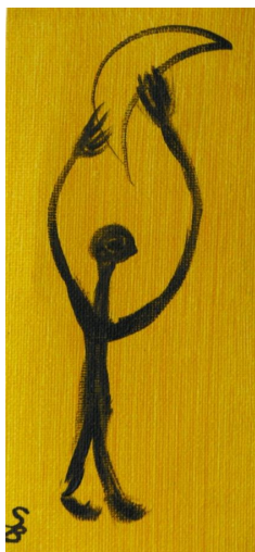
Bajak Zsuzsanna rajza