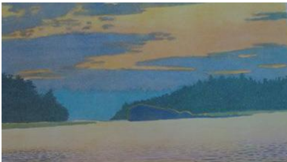
Perger Dénes tájképei