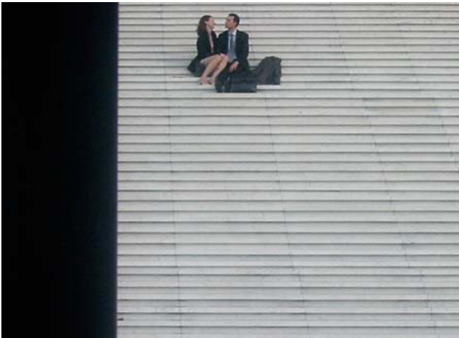
Sütő Zsolt fotó- Blogjából: Párizs-kék