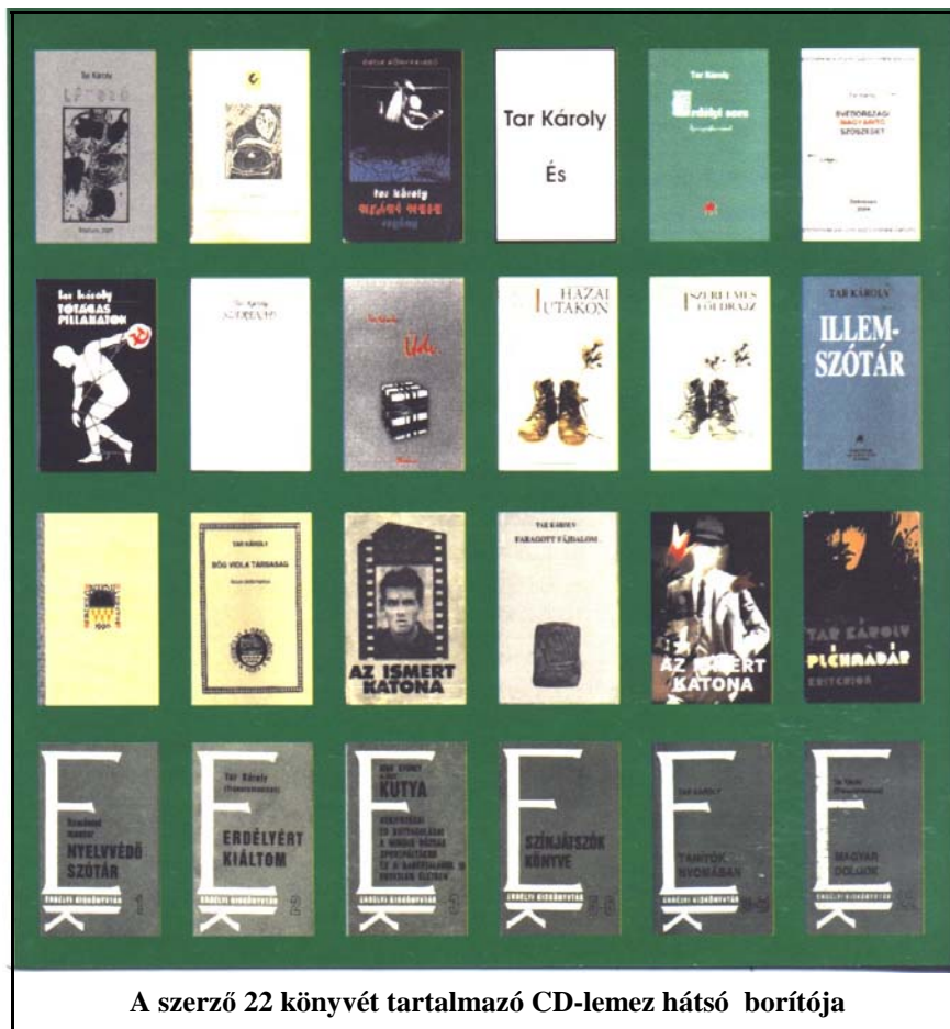
A szerző 22 könyvét tartalmazó CD-lemez hátsó borítója

Ilyen megfontolásból, a jövőre figyelve, készítettem válogatott írásaimat tartalmazó lemezem is, amelyet olvasóim figyelmébe ajánlok.