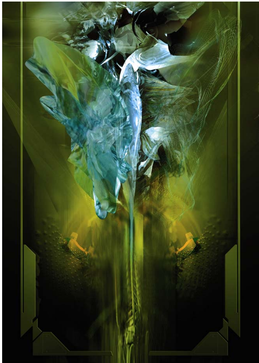
Ács István: Fönix (photoshop, 3d studiomax)