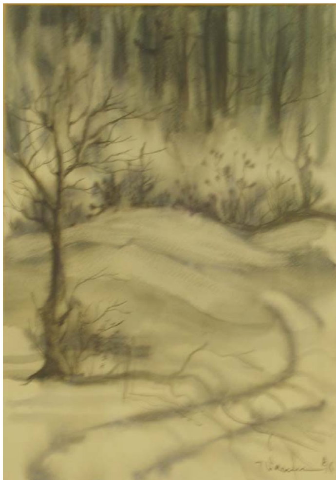
Tompa Anna: Északi táj akvarell