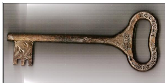
Felhívás Múltját Őrző Ház cím adományozására