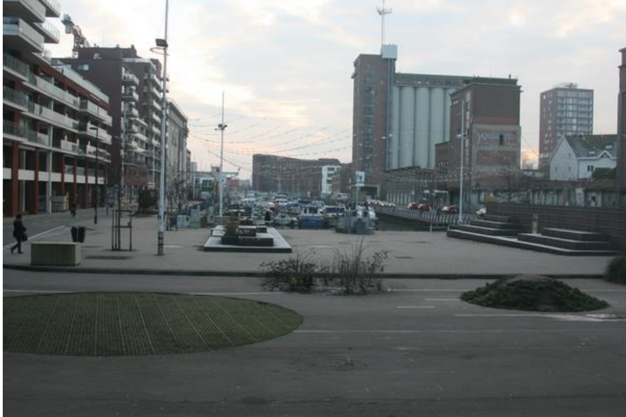
Száz éve még ipari negyed, ma yachtkikötő és sétáló utca, újrahasznosított ipari épületekkel és új lakótömbökkel

Irigylésre méltó, hogy Belgiumban működhet vendéglátóhely egy régi lakóház 70 cm széles falépcsőn megközelíthető emeletén; hogy itt a kerékpárosok és a hölgyek is tudnak kőburkolatú utcákon közlekedni; és, hogy a fafödémek is megfelelnek a statikai és tűzvédelmi szabályoknak – még középületben is... Úgy tűnik, hogy az itteni szabályozás kialakítása során sokkal nagyobb hangsúlyt fektetnek az értékek megőrzésére.