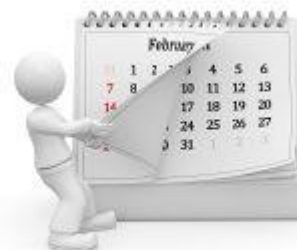
Előjegyezhető 2018-es programok