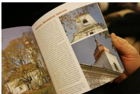
Egy kis mustra – 2017