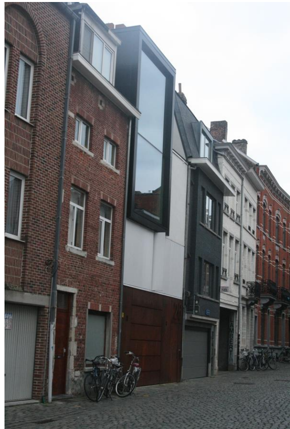
Kortárs épület illeszkedése a történeti városképbe

A kontinensen lefektetett első vasútvonaláról és sűrű vágányhálózatáról méltán híres belga vasút néhány funkcióját veszített járműjavító csarnoka városi tulajdonban, egy nonprofit cég által vendéglátó helyként, üzletként, sportközpontként került üzemeltetésre.