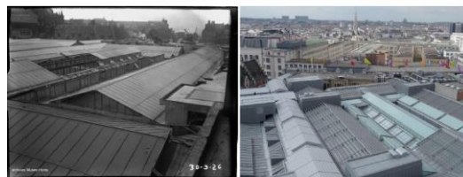
A szakmaiság szerepe a műemlékvédelemben Nemzetközi konferencia - Leuven

February 5-8, 2018 | Arenberg Castle, Leuven