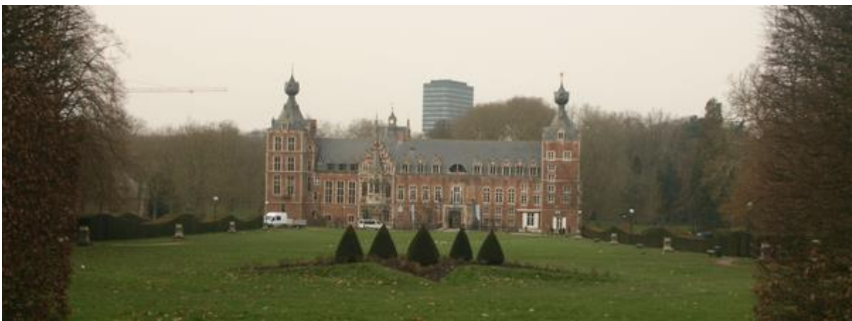
Belgiumban is előfordultak hibák a városfejlesztések során: a magasház pontosan a kastély fő látványába zavar bele