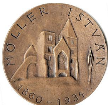
Felhívás Möller Emlékérem adományozására