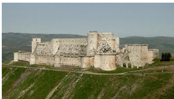
Crac des Chevaliers