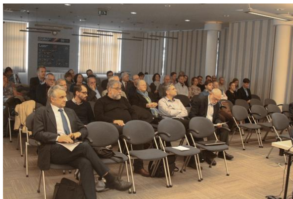
Winkler 75 - Emlékkonferencia - Győr