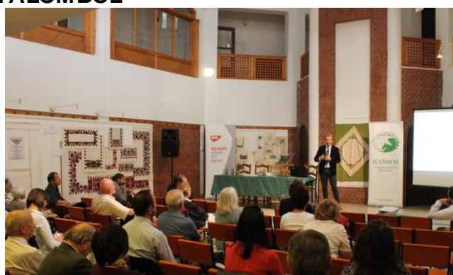
XX. Népi Építészeti Tanácskozás – Békés