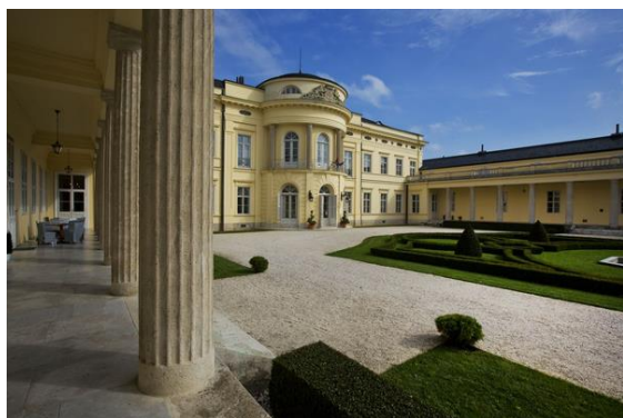
Védett épületek a fogyatékossgal élők szolgálatában konferencia- Fehérvárcsurgó

AZ ICOMOS MAGYAR NEMZETI BIZOTTSÁG FELHÍVÁSAI A 2017. évi ICOMOS DÍJRA, MŰEMLEKVÉDELMI CITROM DÍJRA, PÉLDAADÓ MŰEMLEKGONDORZÁSÉRT DÍJRA