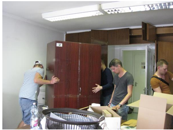
Költöztetik az irodát...