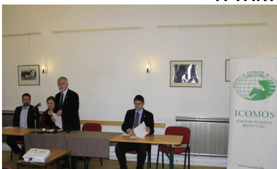
Az ICOMOS Magyar Nemzeti Bizottság XXVI. Közgyűlése - Zsámbék