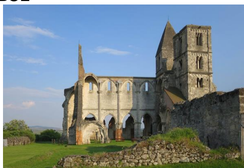
„Esetek – Elvárások - Elvek (nem csak) a Zsámbéki templomromról” – Konferencia