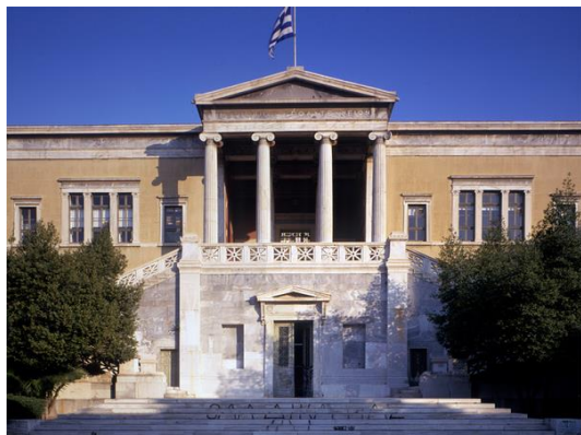
ICOMOS európai elnökök találkozója – Athén Beszámoló