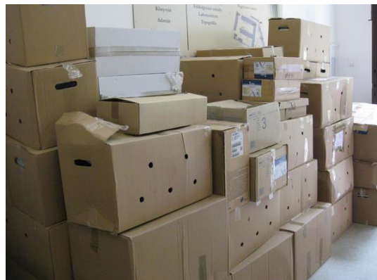
Az ICOMOS Iroda ismét költözött...