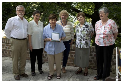
Átadtuk a Möller Emlékérmét