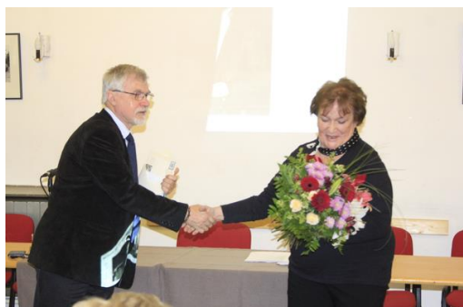
Műemlékvédelmi Panteon 2016