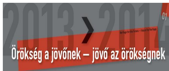
Félidejéhez ért a konferenciasorozat