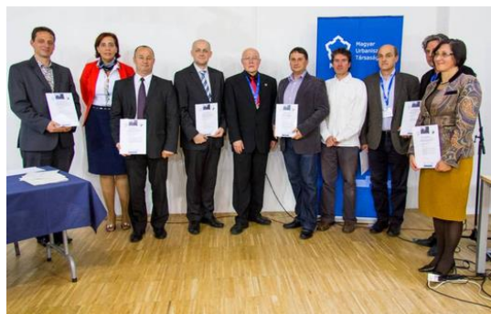
Köztérmeújítási Nívódíj - 2014