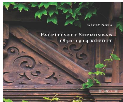
Amit a 19. század soproni faépítészetéről tudni érdemes - Könyvrecenzió