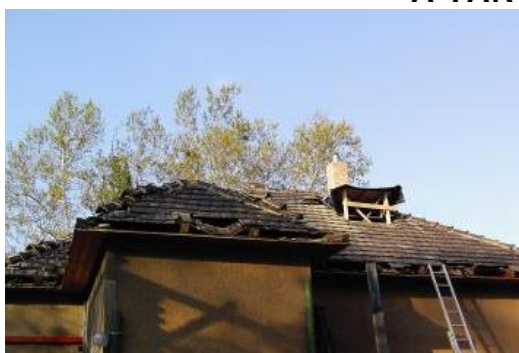
Madárfürdő – Bálint Ágnes meséje a műemlékvédelemről