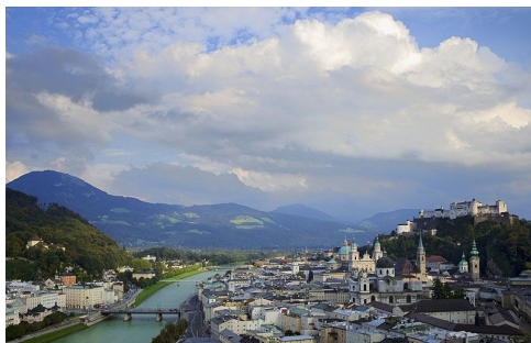
Salzburg - Konferencia: Műemléki jogalkotás és műemlékfogalom