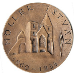
Átadtuk a Möller István Emlékérmét

ICOMOS MAGYARNEMZETIBIZOTTSÁG Műemlékvédelmi Panteon