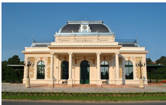
ICOMOS-Díj avatás Gödöllő – Királyi Váro épülete