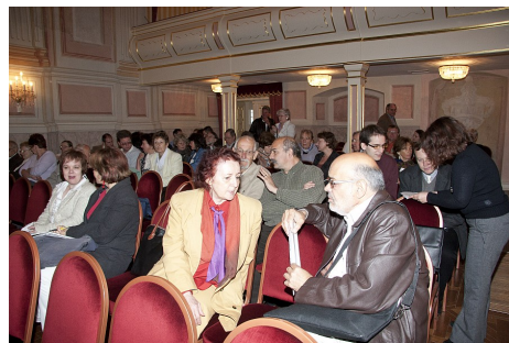
Az ICOMOS XXII. Tisztújító közgyűlése Gödöllőn