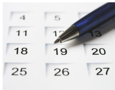
Emlékezzünk rá, hogy... Rejtett évfordulóink