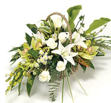
ICOMOS Műemlékvédelmi Panteon

ICOMOS MAGYARNEMZETIBIZOTTSÁG Műemlékvédelmi Panteon