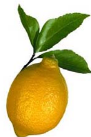
Műemlékvédelmi Világnap 2010 ICOMOS- és Műemlékvédelmi Citrom-díjak