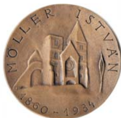
Műemlékvédelmi Világnap 2010 Jubileumi Möller István Emlékérmek