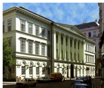
Konferencia a Régészeti Örökségvédelemről és Múzeumok szerepvállalásáról Záródokumentum