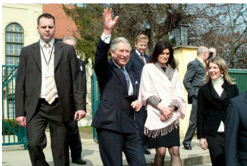
Műemléki kerekasztal a brit trónörökösrel