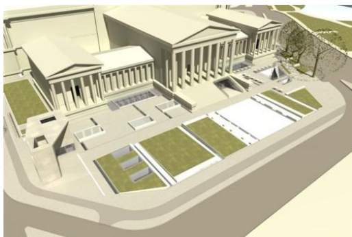
Állásfoglalás a Szépművészeti Múzeum bővítésével kapcsolatban