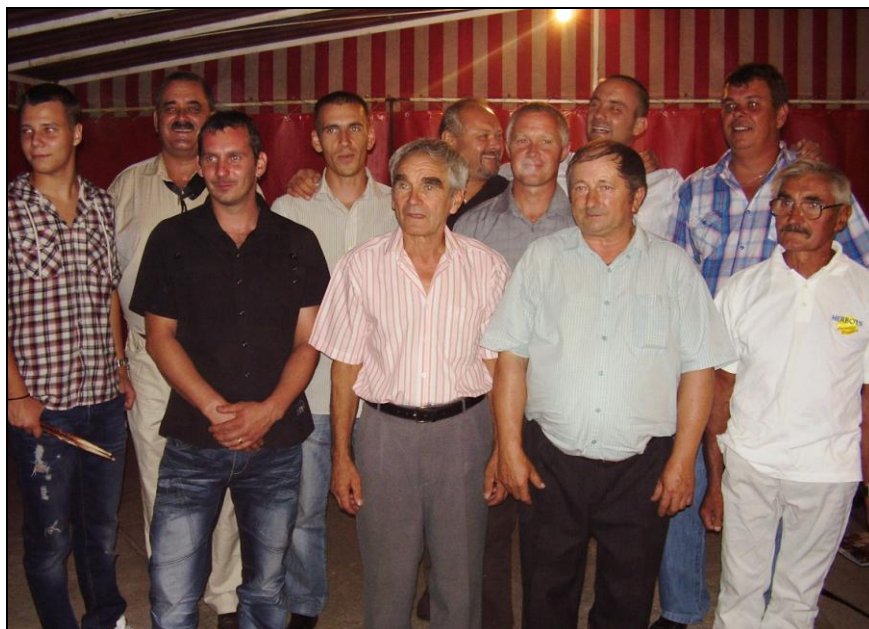
A zenésztalálkozó résztvevői