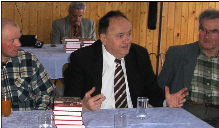
Dr. Torgyán újra nagy lendülettel vetette magát a politikába