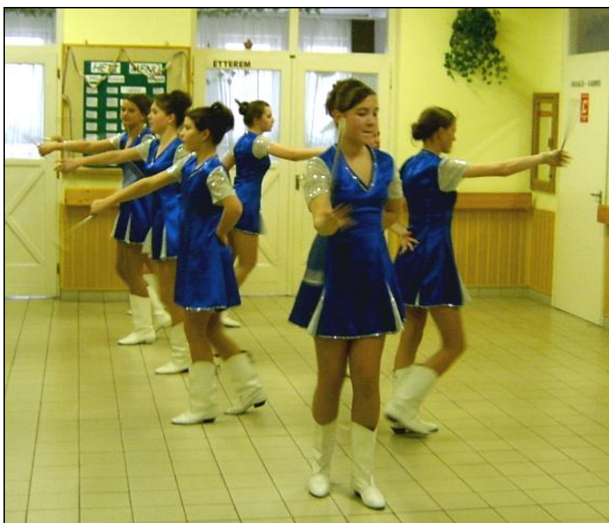
A mazsorettek is szép sikert értek el