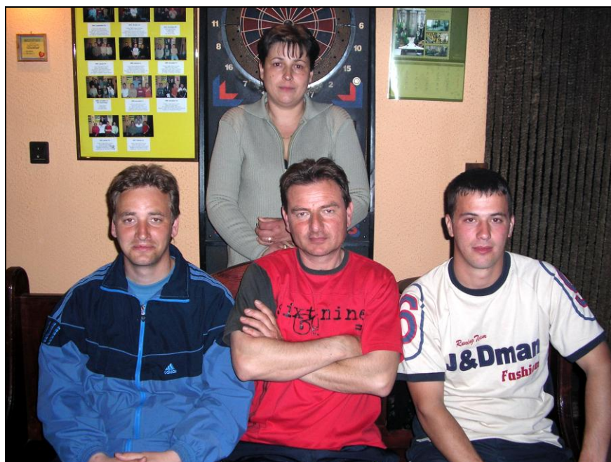
A darts bajnokok a verseny szervezőjével