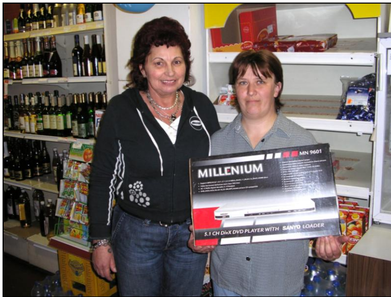
Főnőkasszony a játék fődíjasával