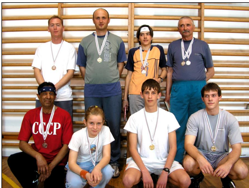
A páros és ifi verseny érmesei