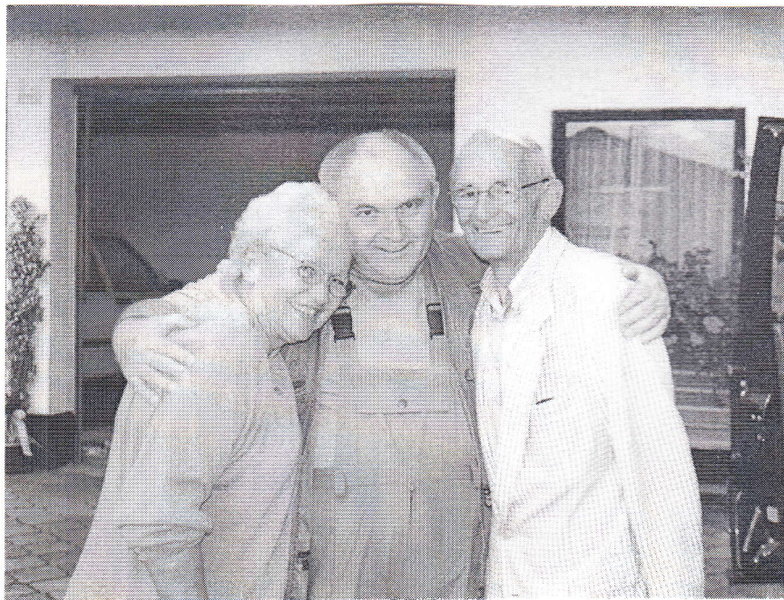
A búcsúzás percei (fotók: dr. Varga Ferencné)

Békével teli csend volt a kicsi kápolnában, és a mi kedves vendéglátónk, Franz meghúzta a harangot. Harangozott bele a csendbe, és csak húzta, lelkesen mutatva hogy milyen gyönyörű a hangja, amit itt Magyarországon készítettek! És mi csak álltunk meghiábottan, és csodáltuk ezt a pillanatot, hogy a harang csak nekünk szól!