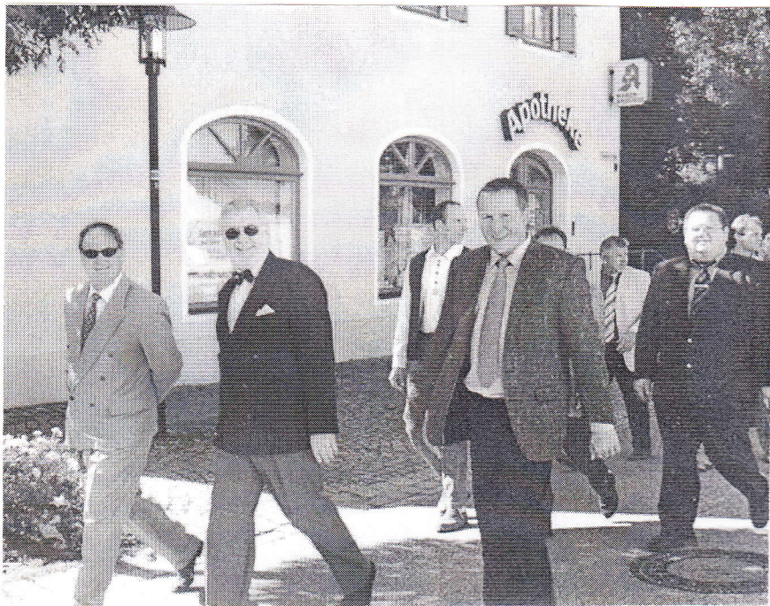
A gróf, a polgármester és a csengelei jegyző a felvonuláson