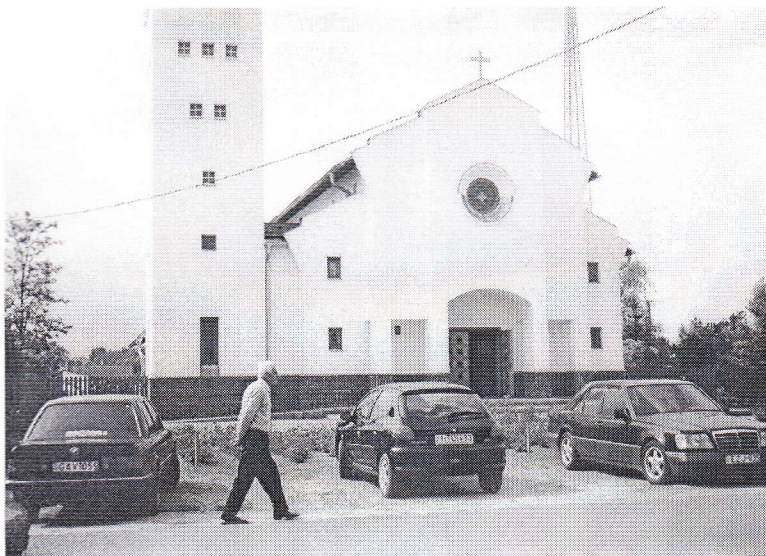
Tircz János: Elmegyek a templomba