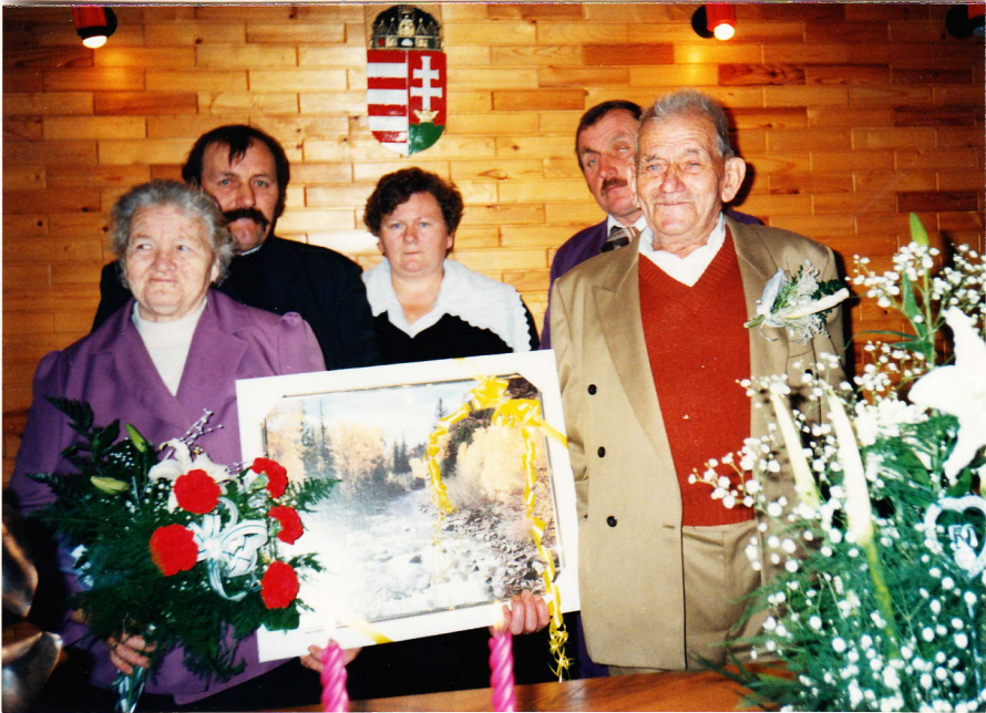
A polgári ünnepség után