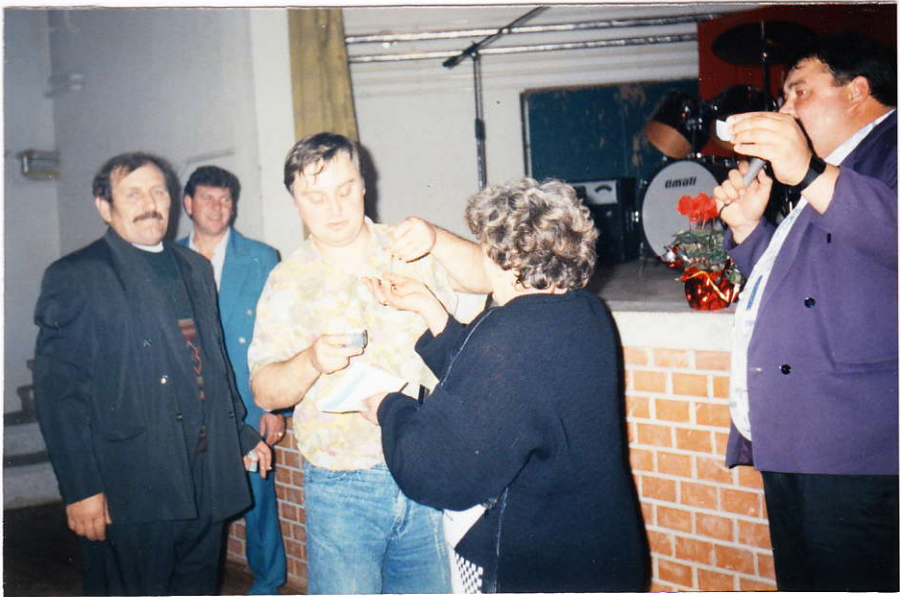
Az aranylánc átadása