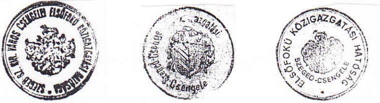
Az I. fokú közigazgatási hatóság pecsétjei

A háborús állapotok miatt azonban nem volt pénz a berendezésre, így több mint egy évig kellett várni az átadásra. Végül 1943. január 2-án kezdte meg működését az I. fokú közigazgatási kirendeltség.