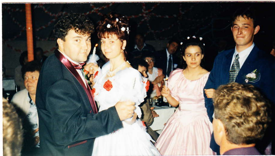
A gyertyafény-keringő közben