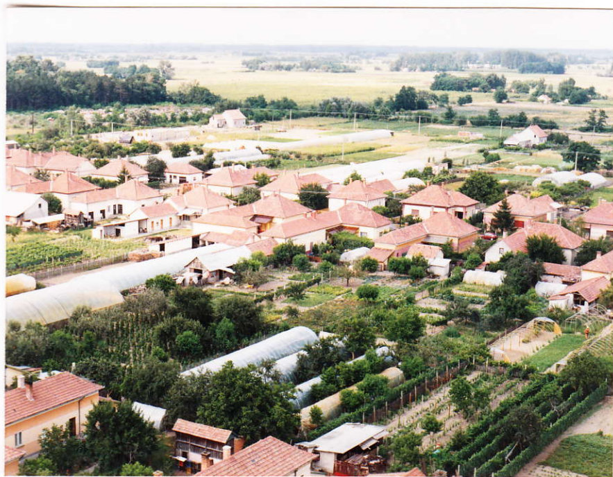
A Dózsa György utca házai