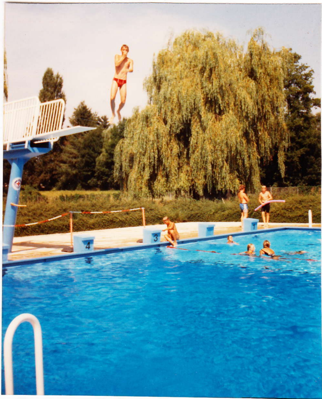
Halálugrás a strandon