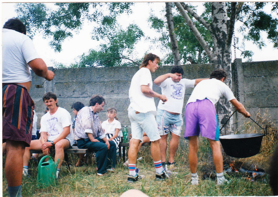
A pörkölt előzsűrizése