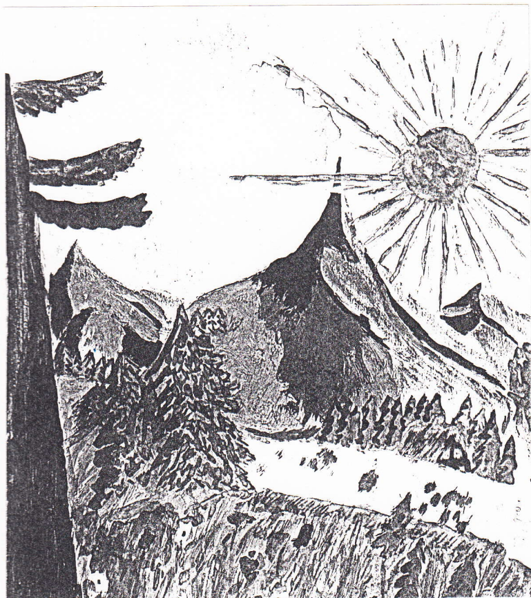
Mészáros Lajos festménye