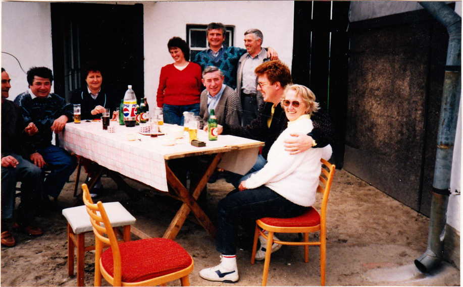
Vendégségben egy csengelei családnál