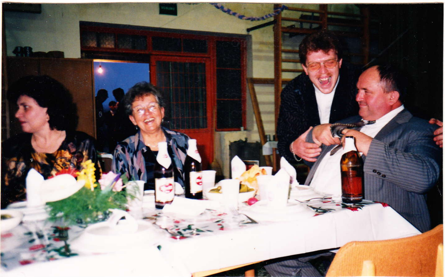
Izelítő a búcsúest hangulatából