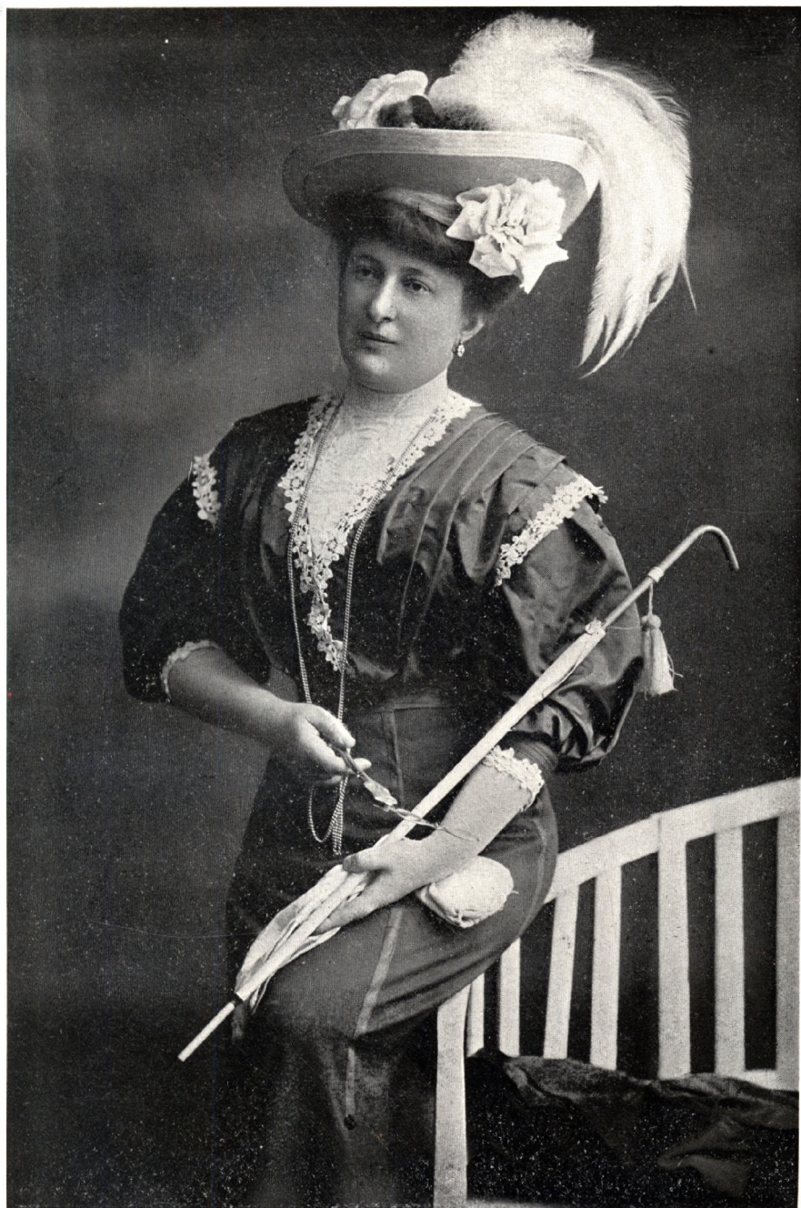
WESZELY LIPÓT ÉS TÁRSA AUTOTÍPIÁJA. (A műintézet Budapest V, Dorottya-u. 11. sz. a.)