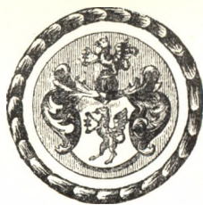
A jeni könyvnyomtatók pecsétje 1657-ből.

A lipcsei és jeni könyvnyomtatók tehát a XVII. század közepe táján még nem ismerhették a címerlegendának azt a formáját, amelyet Birken 1668-ban közölt, mert különben okvetlenül megemlékeztek volna a szedők sassáról is.