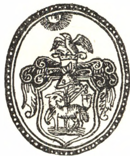
A debreceni nyomda nagyobb, régi signetje.