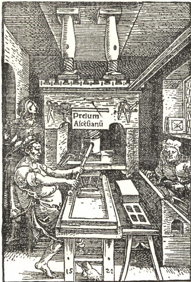
Badius Jodocus nyomdajegye 1520-ból.

A francia renaissance nagy művészetétől, Tory G.-től is bemutatunk egy nyomdajegyet Dankó József idézett műve nyomán. A kiváló termékenységgé rajzoló e nyomdajegyének