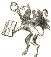
Nyomdász-címerképpen használt griff 1640-ből.

a képe meg is maradt egy egyszerű rézmetszetben, de pajzs nélkül, mint azt ábránk is mutatja.