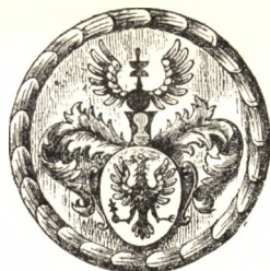
A nürnbergi könyvnyomtatók pecsétje.

Talán a Birken-féle könyvnek köszönhető, hogy a jeni nyomdászok 1720-ban megvál-