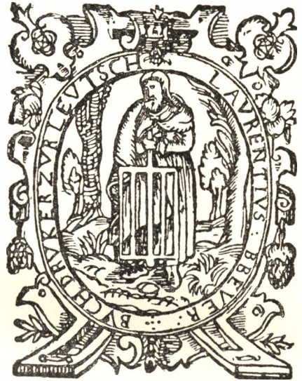
Breuer Lőrinc signetje.

A sok viszontagságot ért Hoffhalter (Skrzetusky) Ráfael maga is gyakorlott fametsző volt, s így több mint bizonyos, hogy szép nyomdajegyét ő maga véste fába. A finom távlati érzékkel megrajzolt rajz előterében kis kertet látunk, s benne egy