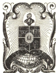
Váci siketnémák könyvnyomdájának sárga színezetű szövegünkbe tördeltem be is mutatjuk. 1875-ből.

A nyomdászjelvények használata még a jelenkorban is elég gyakori, bár a könyvek címlapjairól rég leszorították őket a kiadói jelvények. Nagyobb szabású kompozíciókat azonban már nem találunk köztük. Többnyire pajzsba, vagy valami mértani figurába foglalt impresszumok