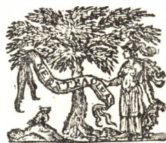
Az Elzevir család signetje.

Kolozsvár első könyvnyomatójának, Heltai Gáspárnak szintén megvolt a maga nyomdajegye, ezt azonban könyveinek nem a címlapján, hanem beljebb, homlokléc vagy vignetta-képpen alkalmazta, még pedig nemcsak ő, hanem ugyanolyan nevű fia is. Egy ilyen homloklécét be is mutatjuk szövegünk közepette. Baloldalt van a tulajdonképpeni nyomdajegy: a paradicsombéli almafa, rajta tekergőző kigyóval, alattuk