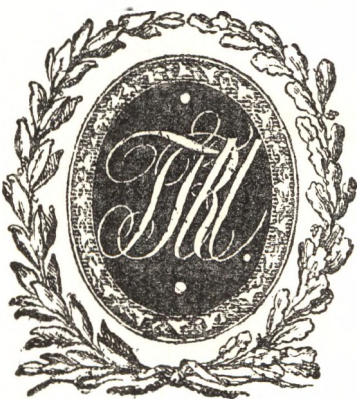
Az egyetemi nyomda sárga színezetű szövegünkbe tördeltem be is mutatjuk. 1824-ből.

„Erdély fénikszé“, Tótfalusi Kiss Miklós nyomtatványain is találunk — bár igénytelen — nyomdajegyét. Halom tetején díszlő kis nefelejtsbokrot ábrázol ez, egyszerű, szinte naív kidolgozásban, ami egy kissé visszásnak is tűnik föl e nagy-hírű betűvívő művésznél. De ha tudjuk, hogy minő bántalmazásokban, meghurcoltatásokban volt része Erdélybe visszatérte óta e nagy férfiúnak: egyszerűben megérthetjük, hogy miért nem emelkedtek ki ide-haza készült nyomtatványai a köznapias-