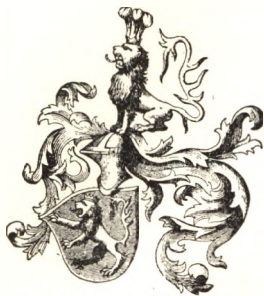
Mentel János cimere.

Mentel János — kit némelyek sokáig a könyvnyomtatás feltalálójának tartottak — Strassburg első könyvnyomtatója volt 1460 körül. Nemesi, de szegény családból származott, s miután az akkoriban szépen jövedelmező nyomdászat révén megszedte magát, családja feledésbe