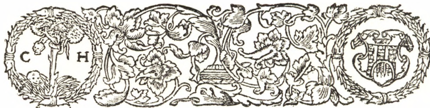
Heltai Gáspár nyomdajegyes homlokléce.

mással átellenben levő kéz szorít meg; a horgony pálcáján kígyó megy végig, s fejét a keresztről lehajtja; az egész pedig célzás a pusztán bujdosó Izráel rézkígyójára s a Megváltó keresztfájára, vagyis a Krisztus általi váltság munkájára.“