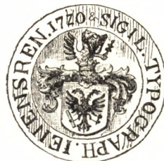
A jeni könyvnyomtatók újabb pecsétje 1720-ból.

A jeni könyvnyomtatónak már 1657-ben volt címeres pecsétjük, aminek használhatóságához „felsőbb hatóságaitól” engedélyt kértek és úgy látszik, kaptak is. Sas nincsen e pecséten, hanem helyette festékező labdát markoló griff van a pajzsban is. A pecsét rajzát különben egy odaváló festőművésszel csináltatták.