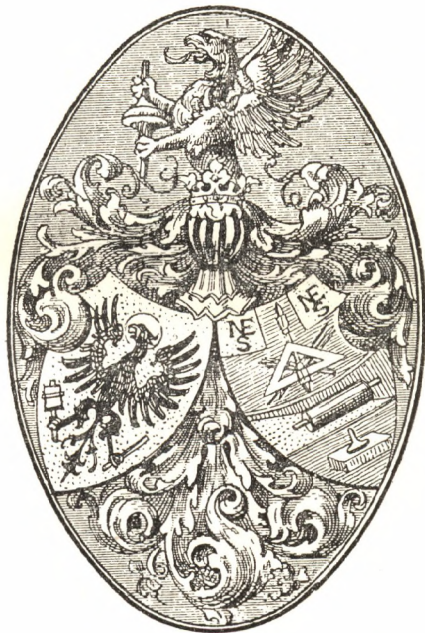
Könyvnyomtatók és litografusok közös címere.

is különb az eddig használt összes címereknél, hogy a sorzót nem a jobb, hanem — mint ez egyébként természetes is — a bal lába karmai közt tartja.