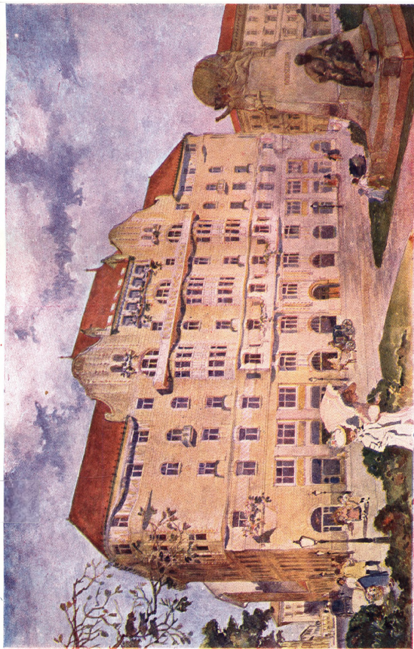
A Magyarországi Könyvtárosok és Betűöntők Segélyező Egyesületének bércfalója

Végen József festménye Herbst Szászú kisért