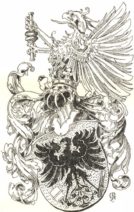
Galgóczy J. rajza.

Ez az indító oka, hogy amikor e kérdésben dönteni kellene: inkább az egyfejű sasos nyomdász-címerek használatát ajánljuk magyar szak-társainknak, mint amelyek használatakor nincsenek kitéve tudatlanság-ból eredő esetleges megrovásnak. Mindjárt be is mutatunk szövegünk közepette egy ilyen egyfejű sassal díszített címert, amely még azzal