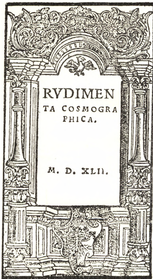
Honter János nyomtatványa 1542-ből.

Debrecen város első nyomdásza tudvalevőleg Huszár Gál református prédikátor volt. Jelvényét Szabó Károly híres bibliografusunk a következőképpen írja le: „Egy felül keresztrel ellátott horgony, melyet alul a horog felett két, egy-