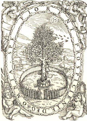
Hoffhalter Ráfael nyomdajegye.

A debreceni könyvnyomtatók közül csupán Huszár Gálnak volt önálló nyomdajegye. A többi nyomdász mind a város címerképét, a zászlós báránt használta, még Hoffhalter Rudolf is, akinek pedig volt már apjáról maradt igen szép nyomdajegye. A debreceni városi nyomdának signetjét, a zászlós báránt különben háromféle dekorációban is bemutatjuk szövegünk közepette. Kettő közülök jó régi: a XVII. századból való; a harmadik újabb.