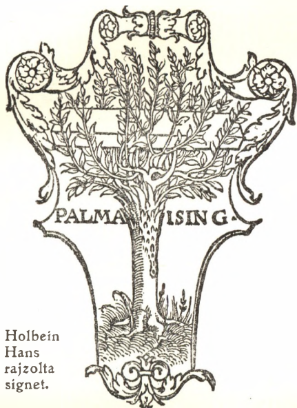
Holbein Hans rajzolta signet.

rendszerint terjedelmes könyvdész volt: a XVII. században bélyegalakra zsugorodott össze, s rajza is fölületessé, művésziatlenné lett. Példa erre a különben oly híres Elzevir nyomdász-családnak e korban használt és ugyanezen az oldalon alantabb bemutatott signetje.