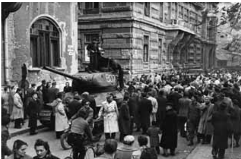
Fotóval szemlélte a szovjet T-34-es tankot a 1956-os forradalom idején Budapesten, 1956.