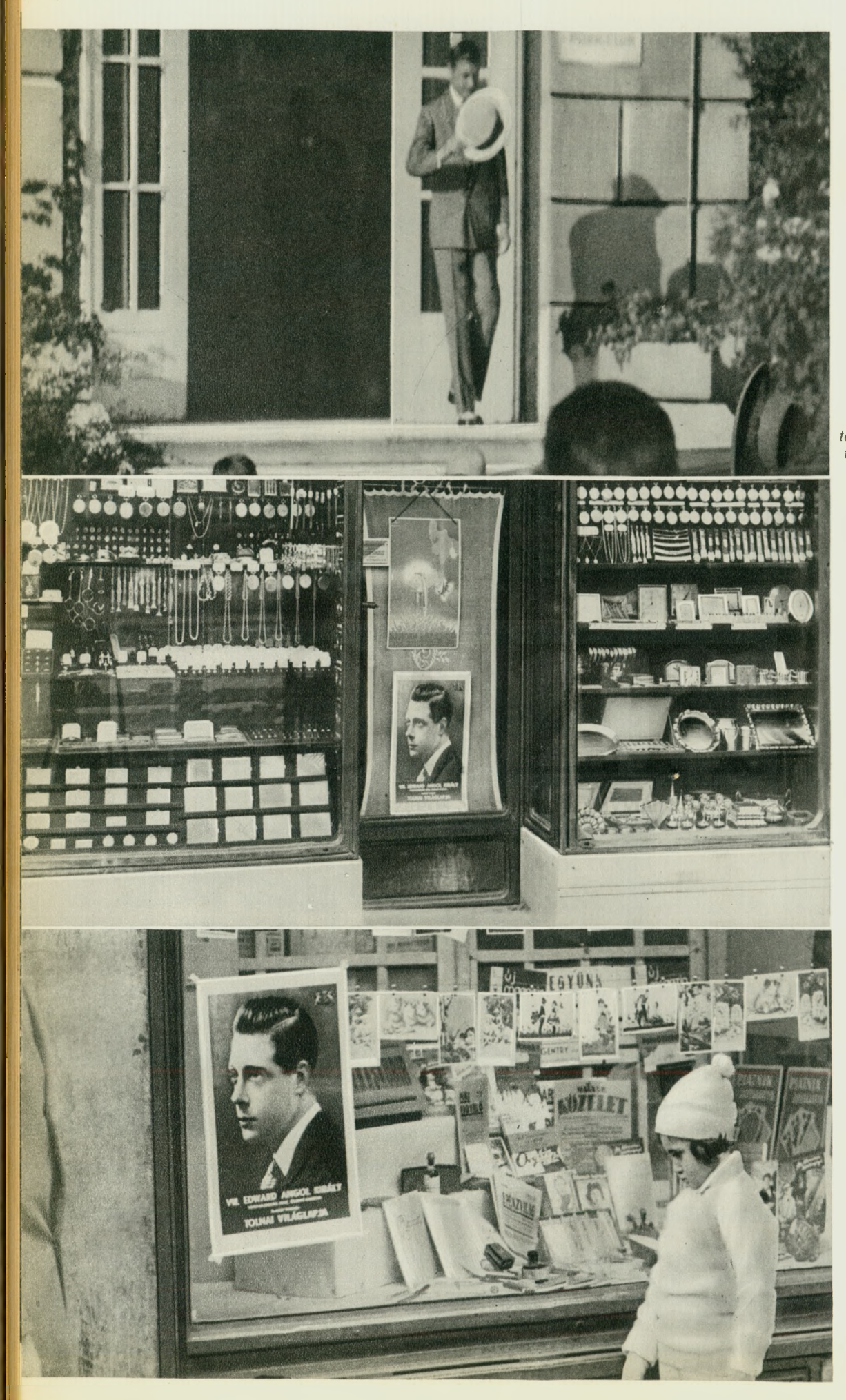
Edward VIII on September 17th 1935 leaving the races after watching the Regent's horse win