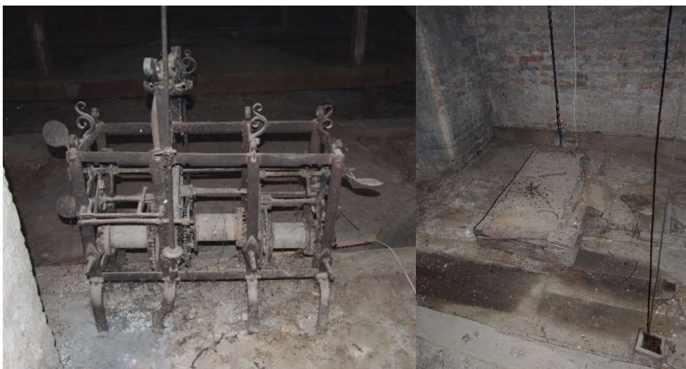
8–9. kép. Az áthelyezett szerkezet és ledeszkázott egykori állása.

Aszalai toronyórája egyre inkább elavulttá lett. A templomtornyok szinte mindenképpen a 19. század második felében, de a 20. század fordulóján már-már törvényszerűen új óraszerkezeteket állítottak fel, ám a belényesi római katolikus plébániatemplom tornyában az oly sok és meddő vita tárgya, az 1757-ben felállított szerkezet maradt, inkább mementóként, mintsem pontos időt mutató, közérdeket szolgáló óraként. A tárgyra vonatkozó levéltári kutatásainkat követően a helyszínen megbizonyosodhattunk arról, amit korábban nem reméltünk: Aszalai István óraszerkezete lényegében ép állapotban, ma is megtekinthető a torony és a hajó fedélszéke közötti átjáróban, tehát nem eredeti helyén.