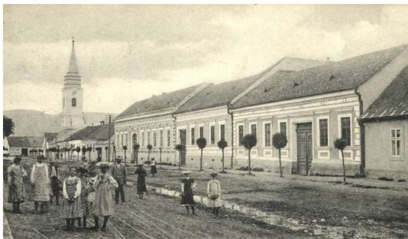
6–7. kép. A belényesi Magyar utca a református templommal