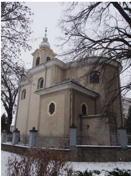
3. kép. A római katolikus plébániatemplom.

A magunk részéről ezúttal hozzátesszük, hogy e belényesi templom mind a mai napig a magyar technikátörténetnek is egy igen becses emlékét őrzi. Kitűnő írásának egy lábjegyzetében már Bíró is említette, hogy „...a toronyórát 1757-ben Forgách ajándékozta a templomnak [...] Az óra 1812-ben elromlott s csak nagynehezen javították ki 1826-ban.” 5 E toronyórával kapcsolatosan korábban már volt egy feltevésünk, melyet mostani levéltári kutatásaink igazoltak. Szűk évtizeddel korábban ugyanis, 1748-ban a nagyváradai plébániatemplom (akkor püspöki széktemplom is) számára ugyancsak Forgách Pál rendelt óraszerkezetet a térség vélhetően egyedüli toronyóra-készítő műhelyében, Debrecenben. Aszalai János és fia István 240 rajnai forintért készítették el Nagyvárad legelső templomi toronyóráját. Kézenfekvőnek tűnt feltételezni, hogy ugyanazon műhelyből került ki a belényesi szerkezet is. 6