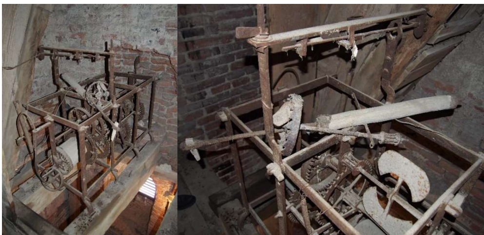
14–15. kép. Érszakácsi református templomának 1760 után készült, megbomlott állapotú, ugyancsak orsóátlású óraszerkezete.

Terepmunkánk során a bihari és azzal szomszédos térségben e belényesi műtárgyon kívül egyetlen, máig fennmaradt orsójáratú szerkezetet találtunk, az egykori középszolnoki egyházmegye területén lévő Érszakácsi református templomának tornyában, melyet már egy 1809. évi összeírás is romladozott állapotúként jegyzékelt. 18