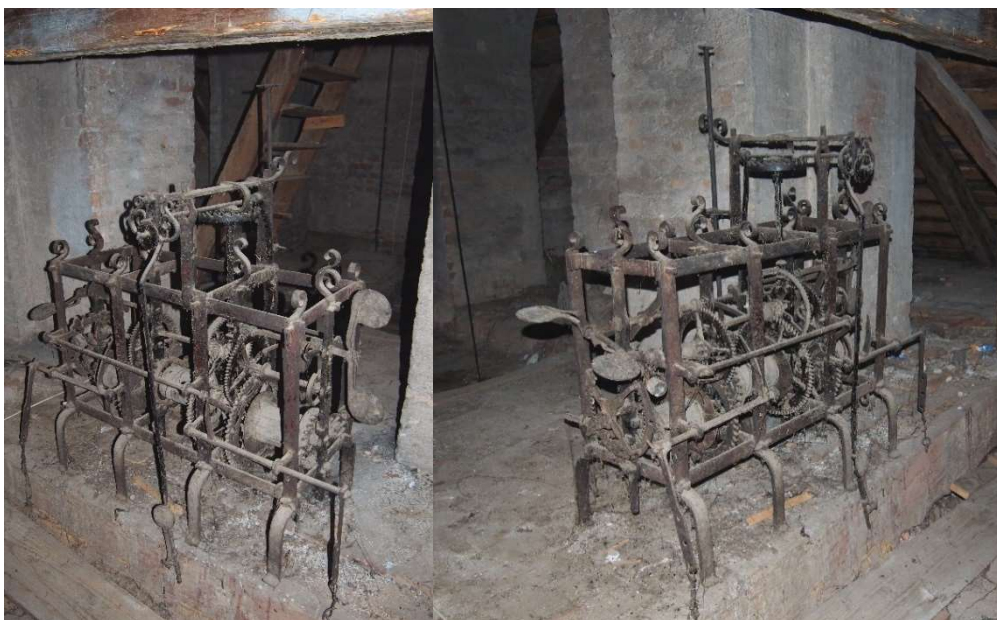
4–5. kép. A belényesi óraszerkezet 2019 januárjában.

A belényesi óraszerkezet működésének első félévszázadából egyetlen adatot sem őrzött meg a kutatható iratanyag, az alább ismertetett peres eljárás során azonban kiderült, hogy a szerkezet a mindenkori harangozó gondozása alatt állt, egyetlen rövidke időszakban felügyelte azt egy helyi órásmester. A századforduló táján jelentkezhetnek a komolyabb meghibásodások, egy 1806. évi részletes leltárba már fel sem vették az órát, s az 1823. évi általános vizitációkor sem említették. 10 Eddigi kutatásaink azt sejtették, hogy általában egy-egy régebbi, 18. századi óraszerkezet mintegy fél évszázadnyi használat után nagyjavítást igényelt, sok esetben újabbra cserélték a már elavultnak tekintett szerkezeteket. Így történt ez Nagyváradon, Szalárdon és Mezőtelegden is. 11