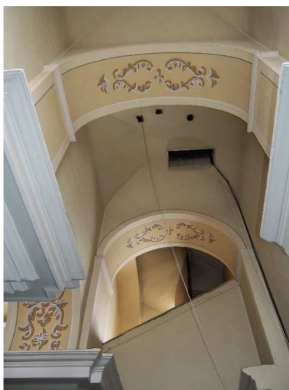
10. kép. A toronyóra egykori állása alulnézetben, a súlyok és az inga ma már hiányoznak.