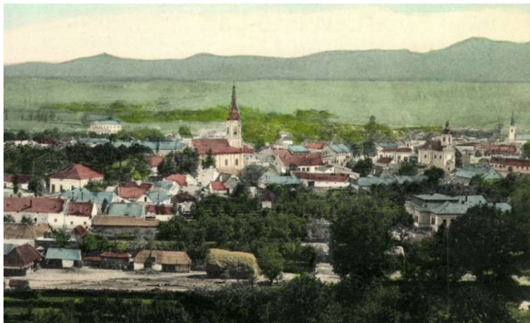
2. kép. Belényes egy 19. század végi képeslapon (az előtérben a görög katolikus templom, attól jobbra a római katolikusoké és távolban, a jobb szélén a reformátusok templomai).

Belényes első szilárd és díszes templomá 3 azonban a római katolikus uradalom, pontosabban Forgách Pál váradi püspök (1747–1757) építtette a piactér közepén 1752-ben, valószínűleg egy korábbi, kisebb épület helyén. Építéstörténete és elsősorban értékes berendezésének műleírása Bíró József művészettörténész tollából jelent meg 1935-ben. 4 Rokokó oltárainak és oltárszobrainak köszönhetően vélekedése szerint „[...] a belényesi templom pars pro toto maga is kítűnő példája annak, hogy hegyek közé eldugott városkák jelentéktelennek látszó templomai milyen becses adalékokkal járulhatnak a magyar művészet fejlődéstörténetéhez.”